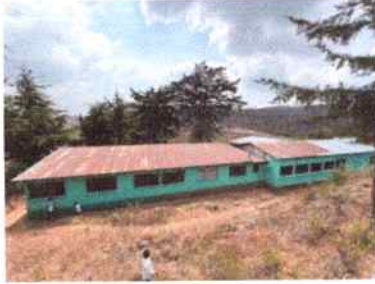
Foto1: REPARACIÓN DE TECHO