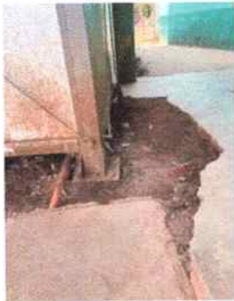
Foto: 5 REPARACIÓN LOSA EN PATIO