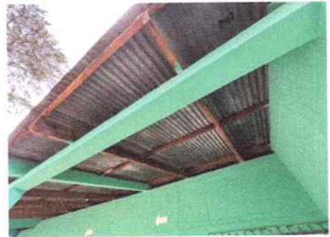
Foto: 6 SUSTITUCIÓN DE ESTRUCTURA PARA TECHO

Observación: Si es necesario se pueden agregar hojas adicionales y actualizar el número de hojas.