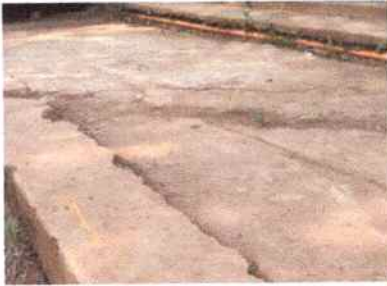
Foto3: REPARACIÓN LOSA EN PATIO