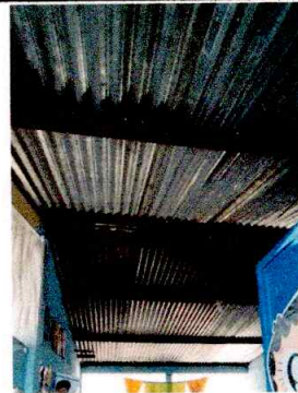
Foto4: CUBIERTA DE TECHO