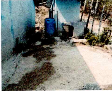
Foto1: MODULO DE BAÑOS