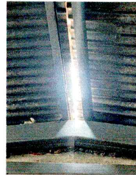
Foto4: INSTALACION DE CAPOTE