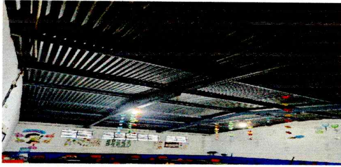
Foto1: SUSTITUCION DE LAMINA EXISTENTE POR LAMINA TROQUELADA CALIBRE No. 26