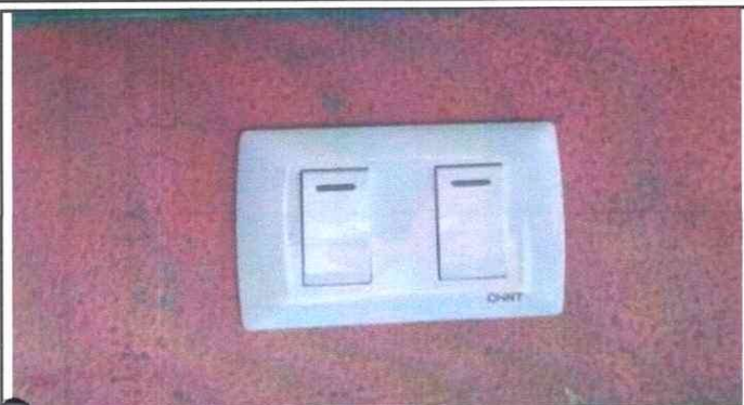
14. Reparación de Sistema Eléctrico.