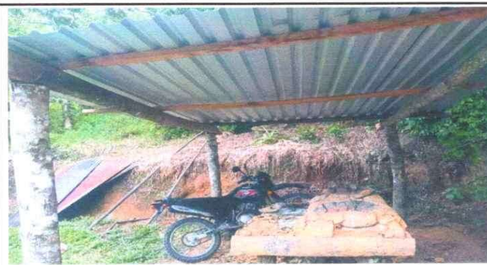
1. Cubierta de Lámina. 1.1.