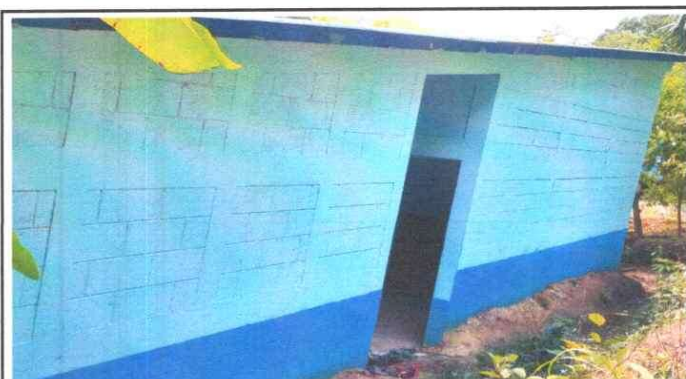
Pintura en Muros Exteriores e Interiores. 9.1