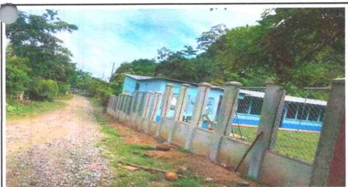
15. Muros perimetrales 15.1