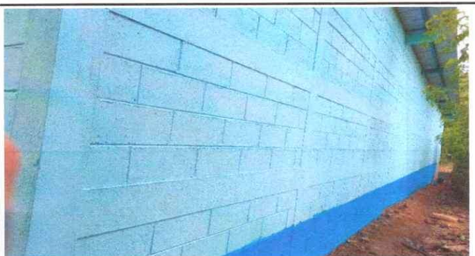
Pintura en Muros Exteriores e Interiores. 9.1