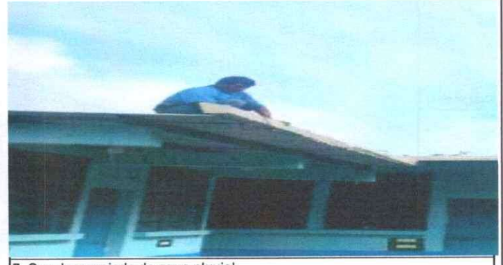
7. Canales y vajada de agua pluvial.

Observación: Si es necesario se pueden agregar hojas adicionales y actualizar el número de hojas.