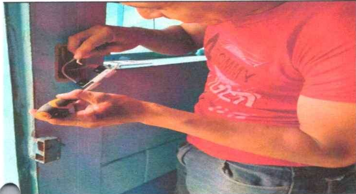
17. Reparación de Sistema Eléctrico.