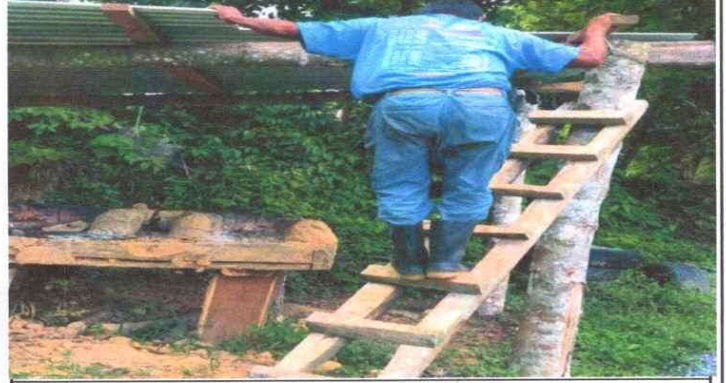
1. Cubierta de Lámina. 1.1.