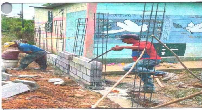
15. Muros perimetrales 15.1