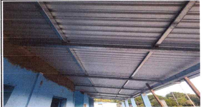
2) EL SOPORTE ES DE MADERA RUSTICA CON POLILLA Y PODRIDA