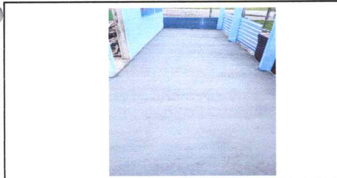
5) EL PISO ESTA CON GRIETAS DETERIORADOS Y ES NECESARIO SUSTITUIRLO