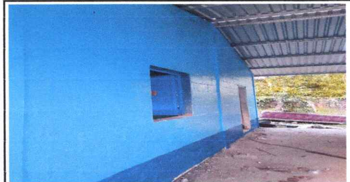
6) LAS PAREDES DE LA ESCUELA NECESITAN PINTURA INTERIOR Y EXTERIOR YA QUE NO SE HAN PINTADO DESDE HACE MUCHO TIEMPO

Observación: Si es necesario se pueden agregar hojas adicionales y actualizar el número de hojas.