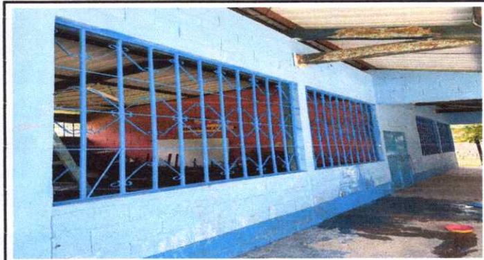
4) BALCONES CON ÓXIDO Y DESAJUSTADOS