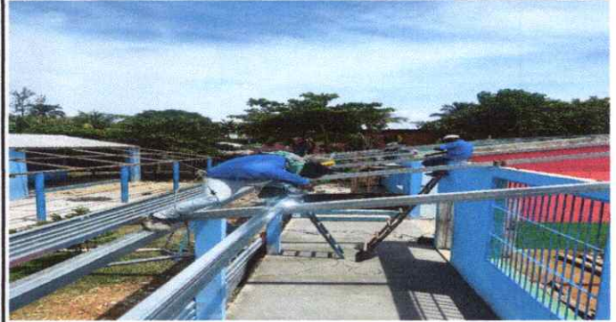
2) CAMBIO DE SOPOERTE DE MADERA RUSTICA CON POLILLA POR ESTRUCTURA METÁLICA