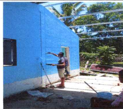
6) LAS PAREDES DE LA ESCUELA NECESITAN PINTURA INTERIOR Y EXTERIOR YA QUE NO SE HAN PINTADO DESDE HACE MUCHO TIEMPO

Observación: Si es necesario se pueden agregar hojas adicionales y actualizar el número de hojas.