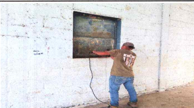
3) VENTANAS DETERIORADAS, OXIDADAS Y DESAJUSTADAS