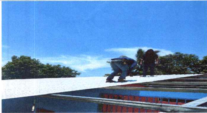
1) LA LÁMINA ESTA OXIDADA Y ROTA POR TENER MÁS DE 20 AÑOS DE SERVICIO.