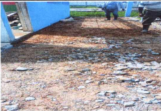
5) EL PISO ESTA CON GRIETAS DETERIORADOS Y ES NECESARIO SUSTITUIRLO