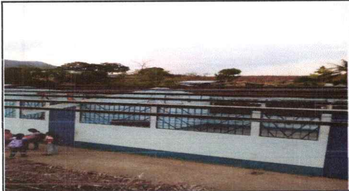
Sustitución de lámina, por lámina troquelada aluzinc calibre 26