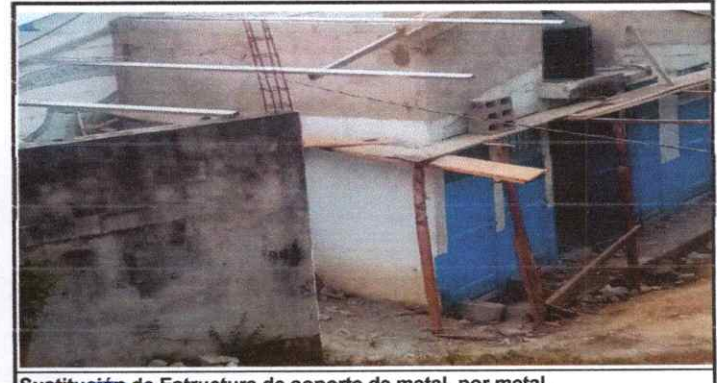
Sustitución de Estructura de soporte de metal, por metal.

Observación: Si es necesario se pueden agregar hojas adicionales y actualizar el número de hojas.