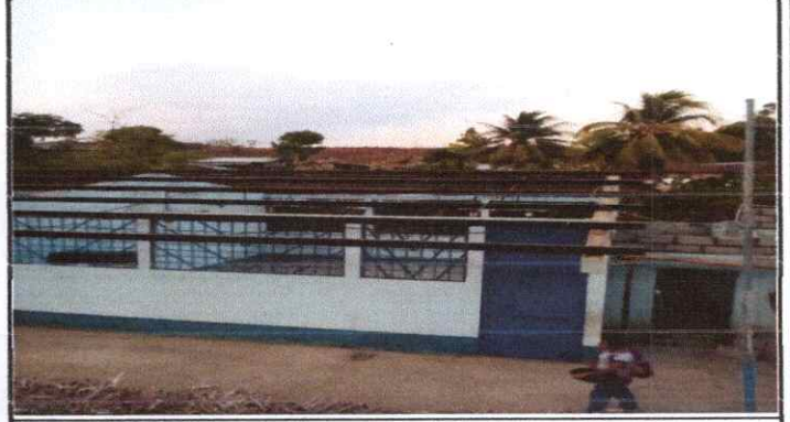
Sustitución de lámina, por lámina troquelada aluzinc calibre 26