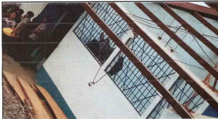
Sustitución de lámina, por lámina troquelada aluzinc calibre 26