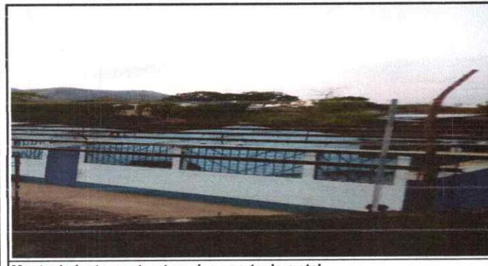
Mantenimiento a estructura de soporte de metal