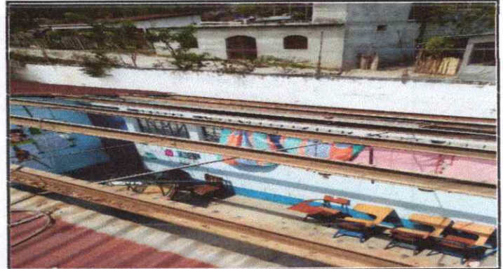
Sustitución de lámina, por lámina troquelada aluzinc calibre 26