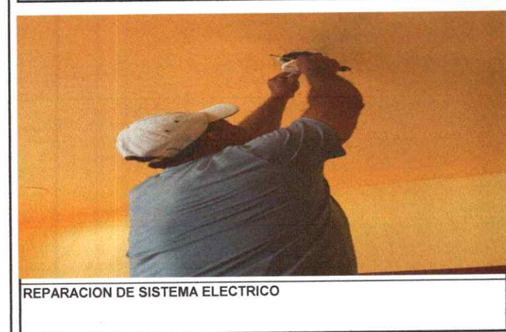
REPARACION DE SISTEMA ELECTRICO