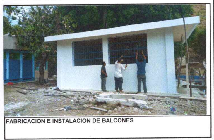
FABRICACION E INSTALACION DE BALCONES