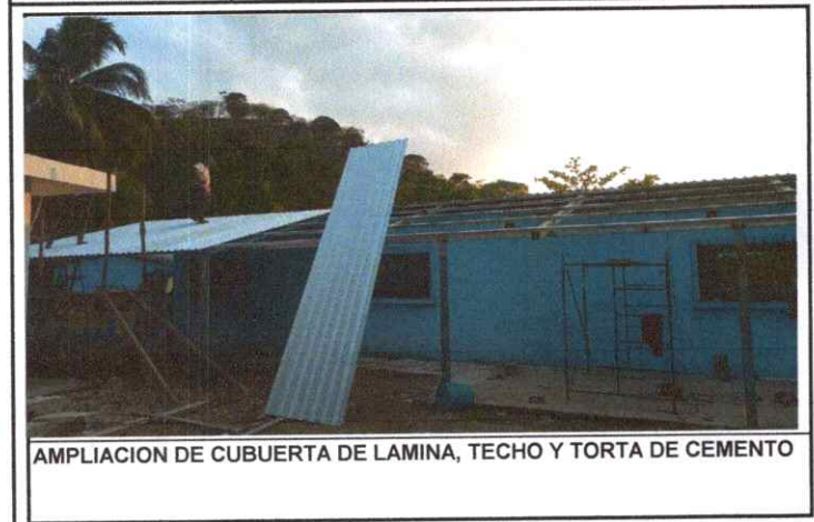
AMPLIACION DE CUBUERTA DE LAMINA, TECHO Y TORTA DE CEMENTO