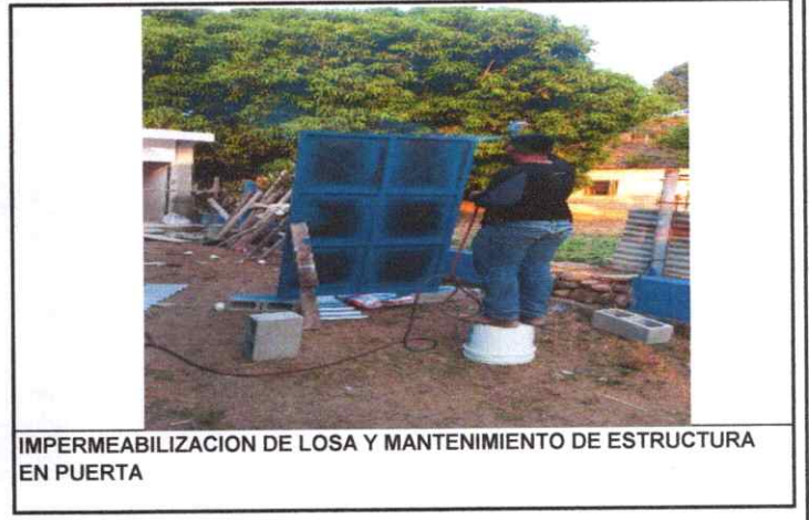
IMPERMEABILIZACION DE LOSA Y MANTENIMIENTO DE ESTRUCTURA EN PUERTA