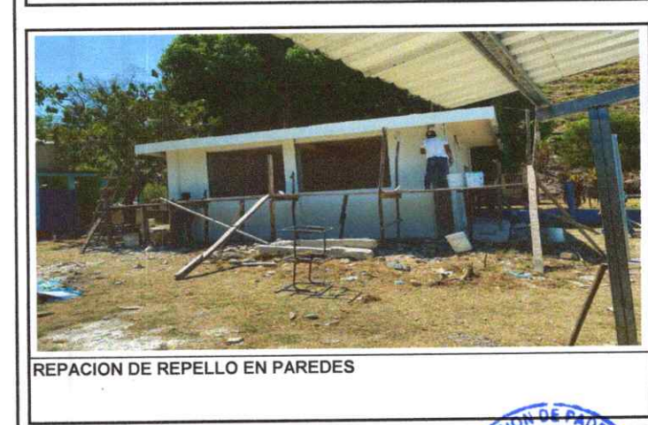
REPACION DE REPELLO EN PAREDES