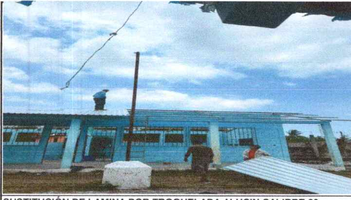
SUSTITUCIÓN DE LAMINA POR TROQUELADA ALUCIN CALIBRE 26