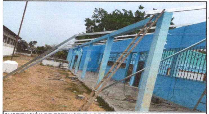
SUSTITUCIÓN DE ESTRUCTURA DE SOPORTE DE MADERA POR METAL