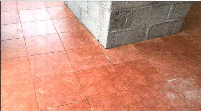
SUSTITUCIÓN DE PISO CERAMICO