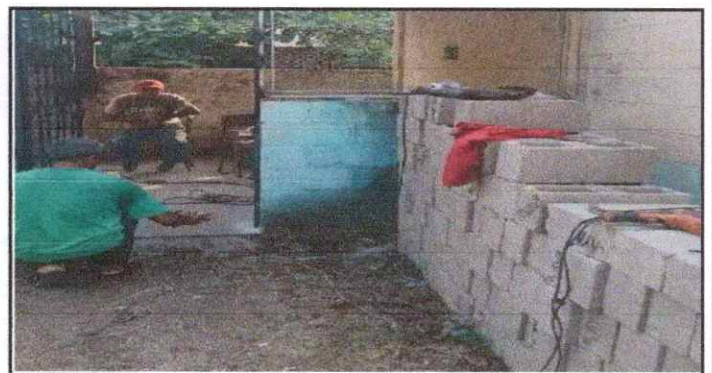
CERNIDO DE MURO

Observación: Si es necesario se pueden agregar hojas adicionales y actualizar el número de hojas.