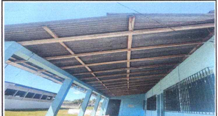
Sustitución de estructura de soporte de madera por metal