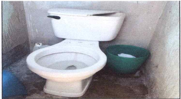
Sustitución de inodoro