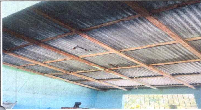
Sustitución de lamina por troquelada alucin calibre 26