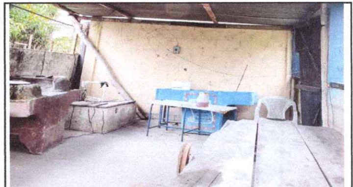
Cernido en muro

Observación: Si es necesario se pueden agregar hojas adicionales y actualizar el número de hojas.