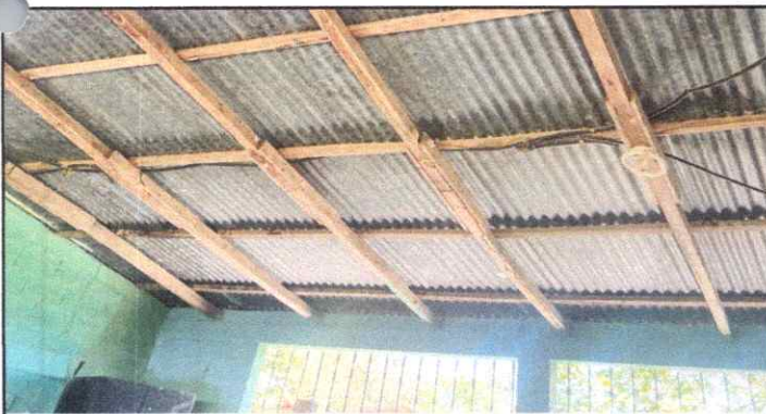
Reparación de Sistema Electrico