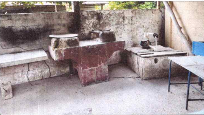
Sustitución de piso ceramico