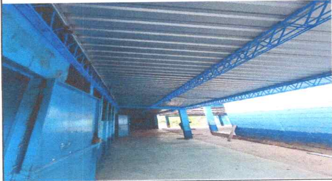
Sustitución de Lámina