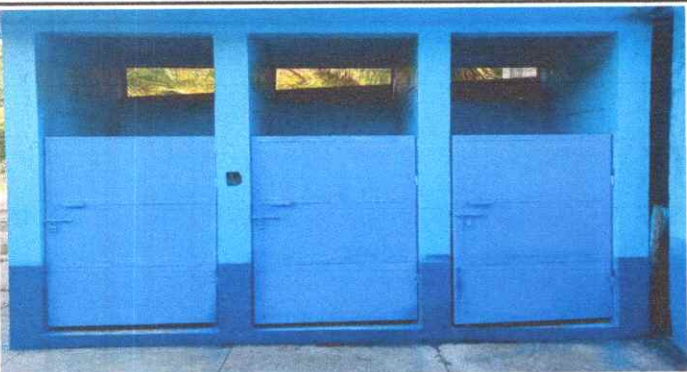
Mantenimiento a Puertas de Metal

Observación: Si es necesario se pueden agregar hojas adicionales y actualizar el número de hojas.