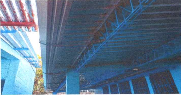
Sustitución de Canales de PVC