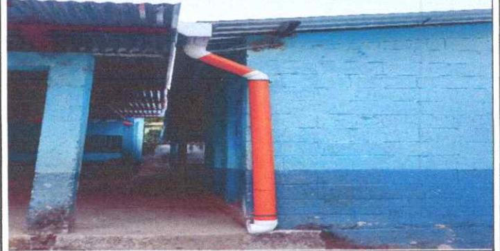
Sustitución de Bajada de Agua Pluvial de Metal por Tubo PVC