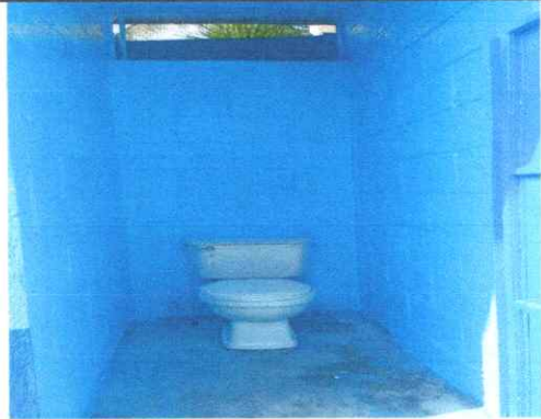
Sustitución de Accesorios y Tapadera de Inodoro