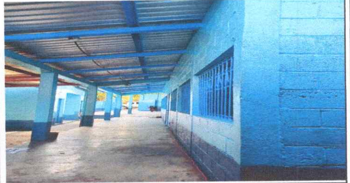
Mantenimiento a Estructura de soporte de metal