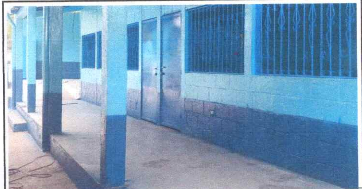
Mantenimiento a Balcones de Metal

Observación: Si es necesario se pueden agregar hojas adicionales y actualizar el número de hojas.