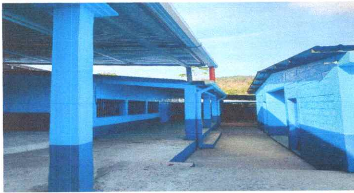
pintura a Muros Exteriores e Interiores