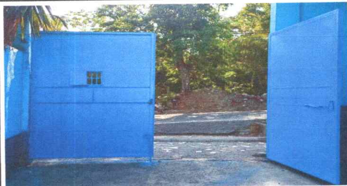
Sustitución de Portones de Metal