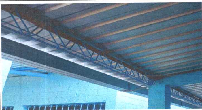
Mantenimiento a Estructura