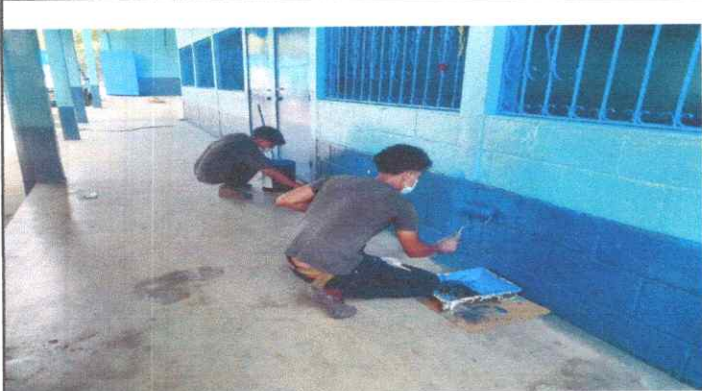
Pintura en Muros Exteriores e Interiores