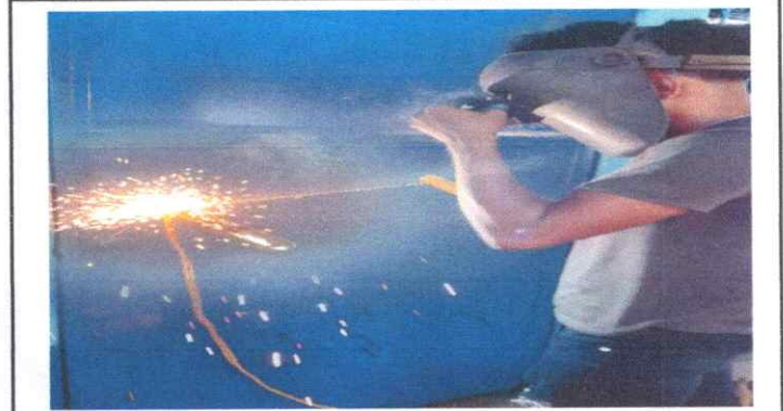
Sustitución de Chapa