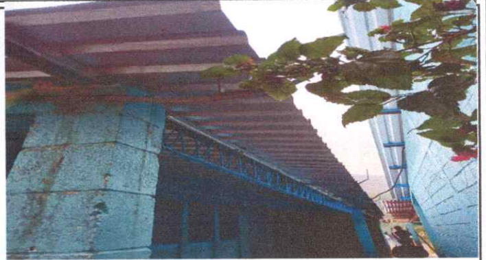
Sustitución de bajada de agua Pluvial de metal por tubo PVC