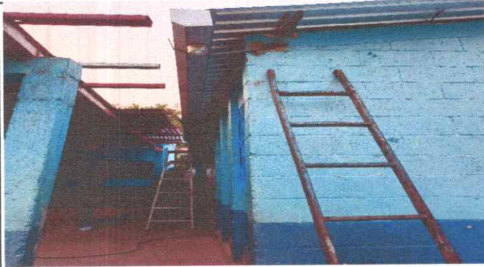
Sustitución de canales de PVC