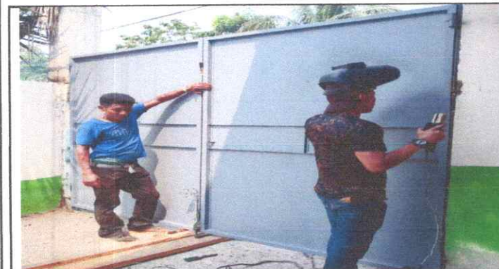
Sustitución de portones de Metal