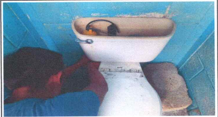
Sustitución de Accesorios y Tapadera de Inodoro