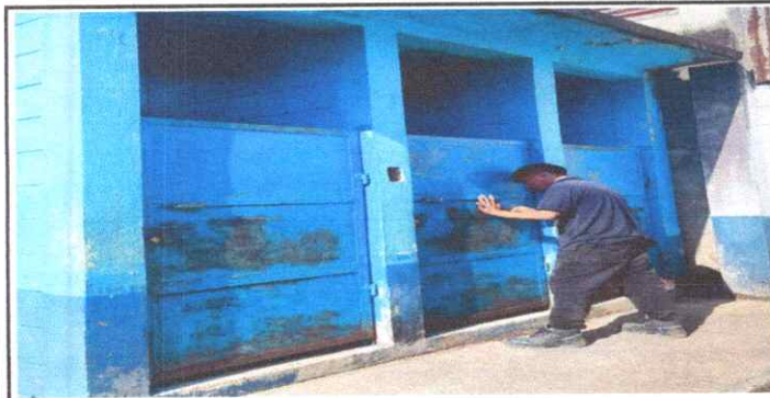
Mantenimiento a Puertas de Metal

Observación: Si es necesario se pueden agregar hojas adicionales y actualizar el número de hojas.