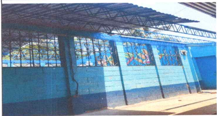
Sustitución de Lámina