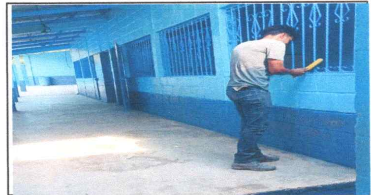
Mantenimiento a balcones de Metal

Observación: Si es necesario se pueden agregar hojas adicionales y actualizar el número de hojas.