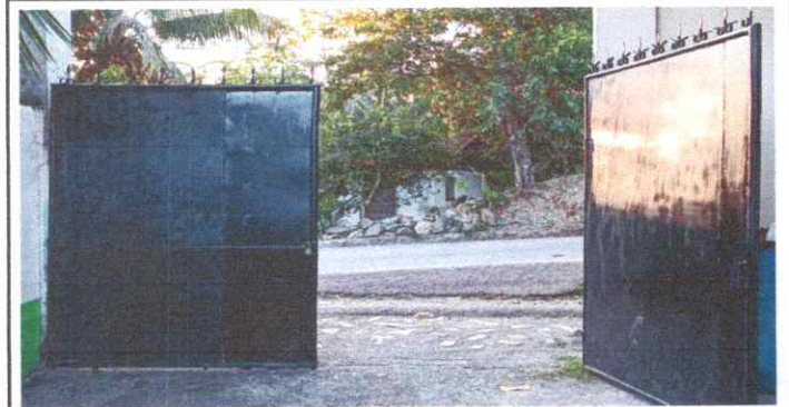
Sustitución se Portón de Metal