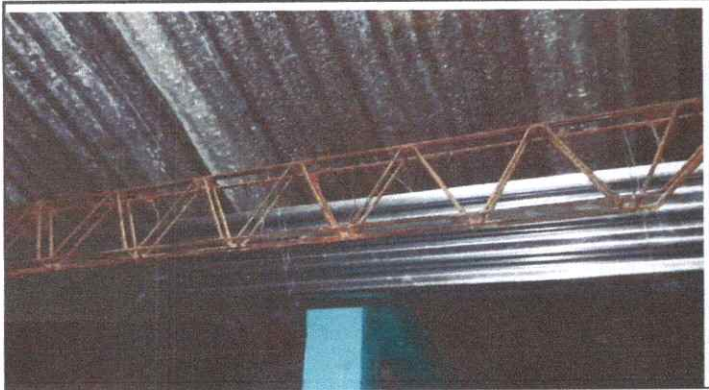
Mantenimiento a Estructura