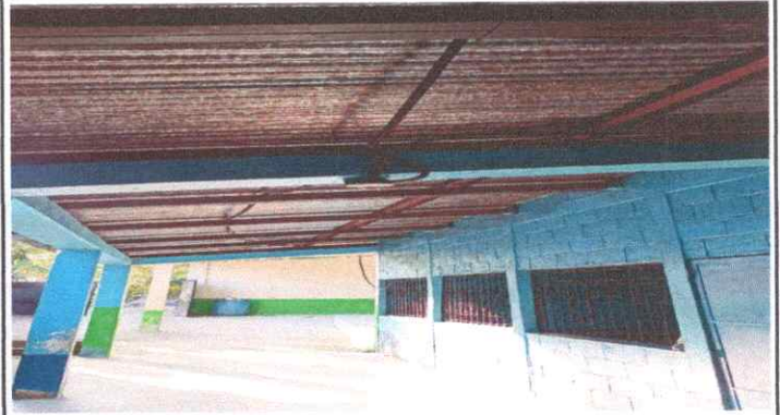
Mantenimiento a Estructura de soporte de metal