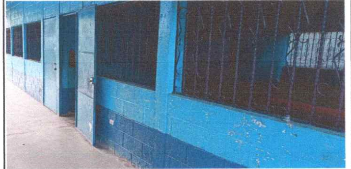
Mantenimiento a Balcones de Metal

Observación: Si es necesario se pueden agregar hojas adicionales y actualizar el número de hojas.