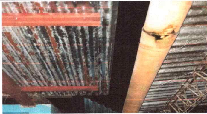
Sustitución de canales de PVC