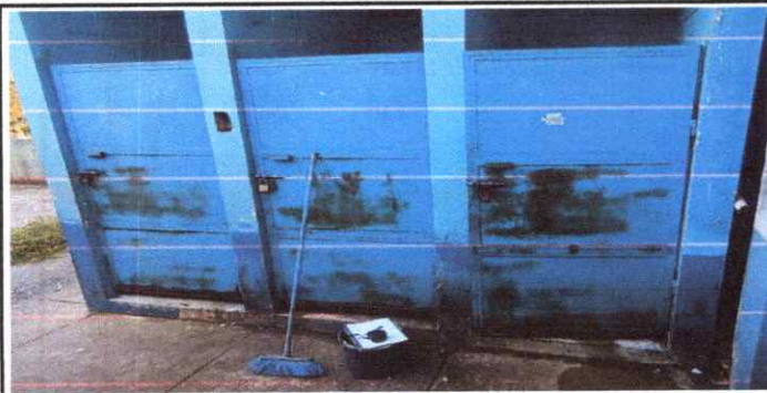
Mantenimiento a Puertas de Metal

Observación: Si es necesario se pueden agregar hojas adicionales y actualizar el número de hojas.