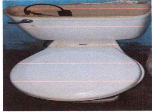
Sustitución de Accesorios y Tapadera de Inodoro