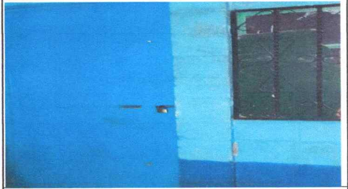
Sustitución de Chapa