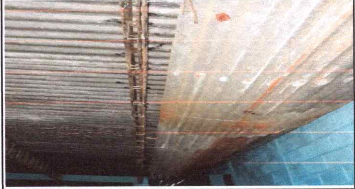
Sustitución de Bajada de Agua Pluvial de Metal por Tubo PVC