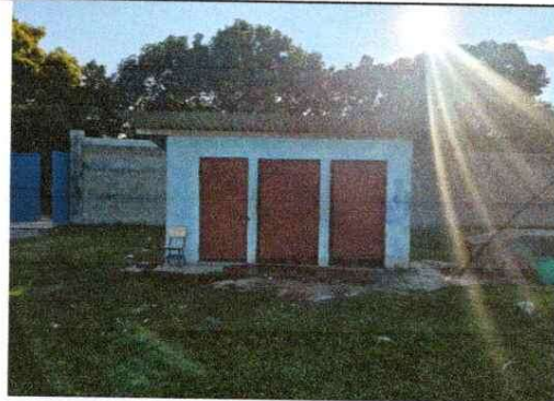
Foto 10: Mantenimiento a estructura de puerta de servicio Sanitario.

Observación: Si es necesario se pueden agregar hojas adicionales y actualizar el número de hojas.