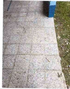
Foto 8: Sustitución de piso de torta de cemento por piso de granito.