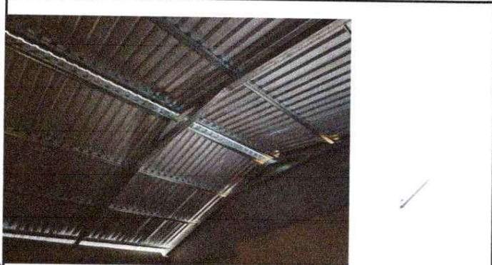
Foto1: Sustitución de lámina por lámina troquelada aluzinc calibre 26