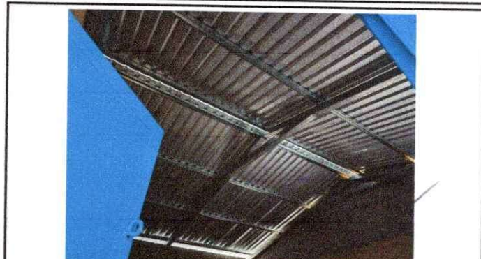
Foto 2: Sustitución de estructura de soporte de madera por metal.