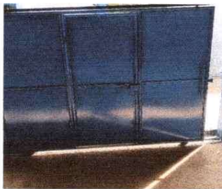
Foto 3.3 Sustitución de portón