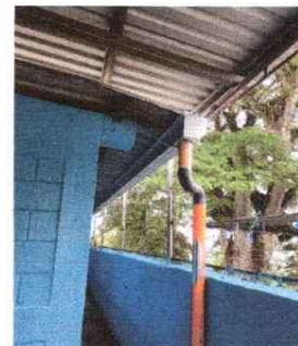
Foto 4 Canales y bajadas de agua pluvial

Observación: Si es necesario se pueden agregar hojas adicionales y actualizar el número de hojas.