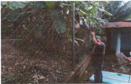
FOTO 5 Reparación de muro perimetral de block

Observación: Si es necesario se pueden agregar hojas adicionales y actualizar el número de hojas.