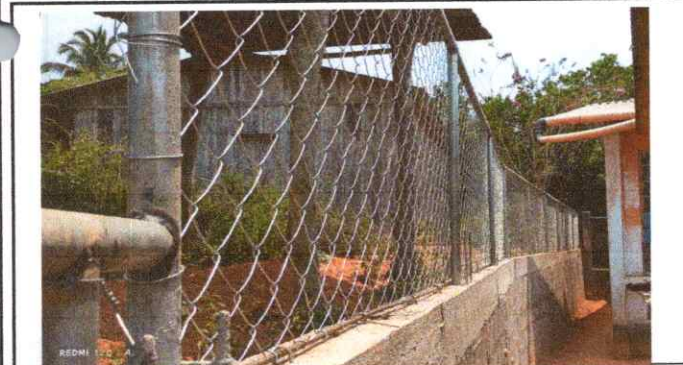
Reparación de muro de contencion