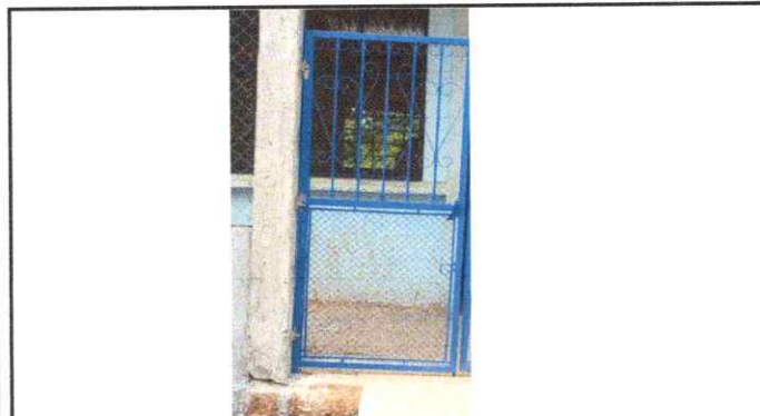
Fabricacion e instalación de puerta de rejas