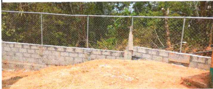
Reparacion de muro perimetral de block