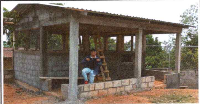
Sustitución de estufa rural (completa) incluye chimenea y plancha de metal