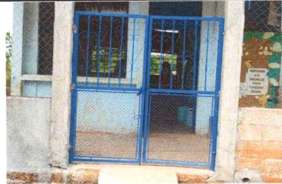
Fabricación e instalación de porton de metal de ingreso