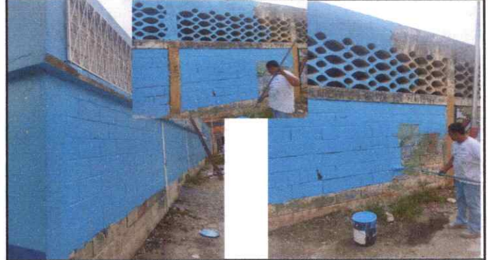
Foto 8: Aplicación de Pintura de Aceite en Exterior de Muro Perimetral.