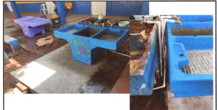
Foto 12: Instalación de Pilas con abastecimiento del servicio de agua entubada.

Observación: Si es necesario se pueden agregar hojas adicionales y actualizar el número de hojas.