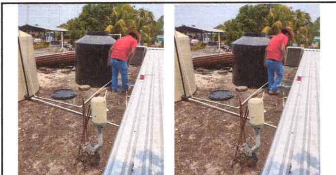
Foto 11: Instalación de Deposito de agua más grande, para abastecimiento de varias áreas del establecimiento.