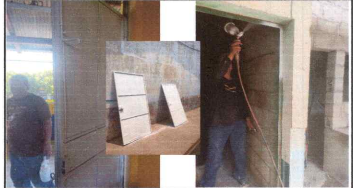
Foto 2: Mantenimiento y pintura anticorrosiva a puertas de todo el establecimiento.