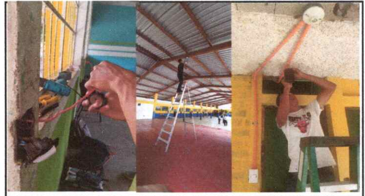
Foto 10: Sustitución de Plafoneras, Interruptores Simples y Dobles, así como Tomacorrientes, Tubo ductos y Bombillas ahorradoras.