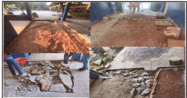
Foto 6: Sustitución de Piso de Concreto en el ingreso del establecimiento.

Observación: Si es necesario se pueden agregar hojas adicionales y actualizar el número de hojas.