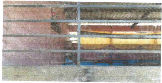
Foto 8: Fabricación e instalación de balcones de hierro en ventana