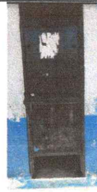
Foto 4: Sustitución de puertas de los servicios sanitarios de 68 por 2.18 metros