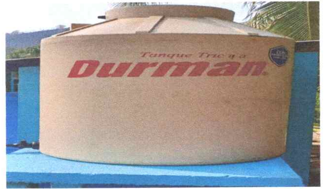
DEPÓSITO DE AGUA INSTALADO