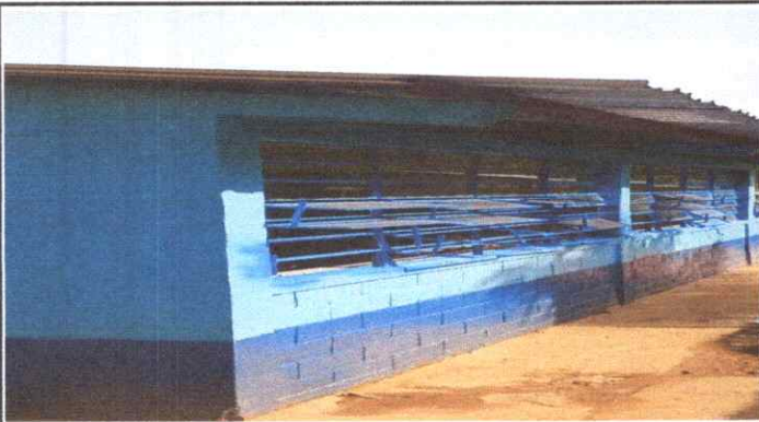
ESTRUCTURA DE METAL PARA VENTANA REPARADA