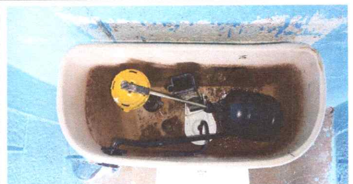
NUEVOS ACCESORIOS DE SANITARIO.

Observación: Si es necesario se pueden agregar hojas adicionales y actualizar el número de hojas.