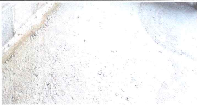
PISO DE TORTA DE CONCRETO SUSTITUIDO