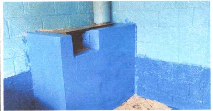
ESTUFA RURAL REPARADA