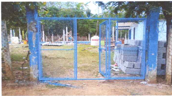
PORTÓN PRINCIPAL, CAMBIO DE MALLA, CAMBIO DE PLANAS, LIJADO, CEPILLADO Y PINTADO.