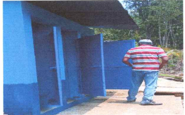
PUERTAS DE METAL REPARADAS