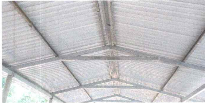
ESTRUCTURA DE TECHO INSTALADA