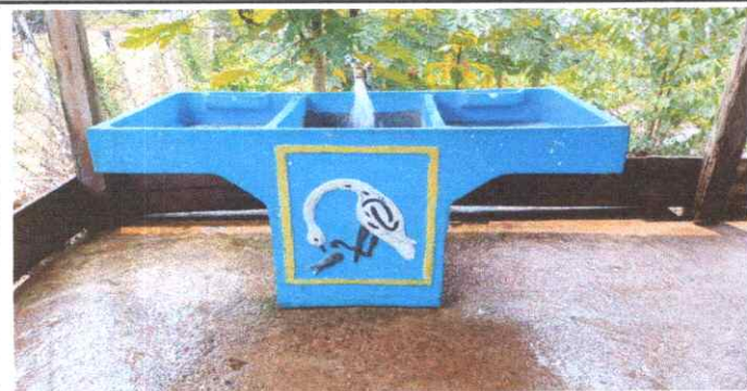
PILA NUEVA DE CEMENTO DE DOS LAVADEROS