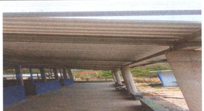
TECHO INSTALADO CON SOPORTE DE METAL

Observación: Si es necesario se pueden agregar hojas adicionales y actualizar el número de Hojas.