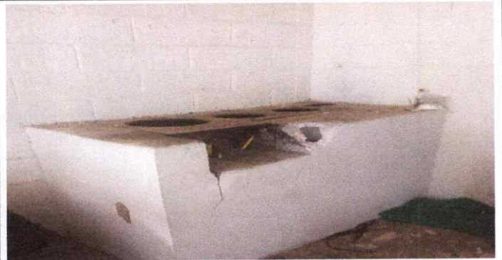
LA ESTUFA PARA COCINAR NO ESTÁ FUNCIONANDO DEBIDO A LAS CONDICIONES PRECARIAS.