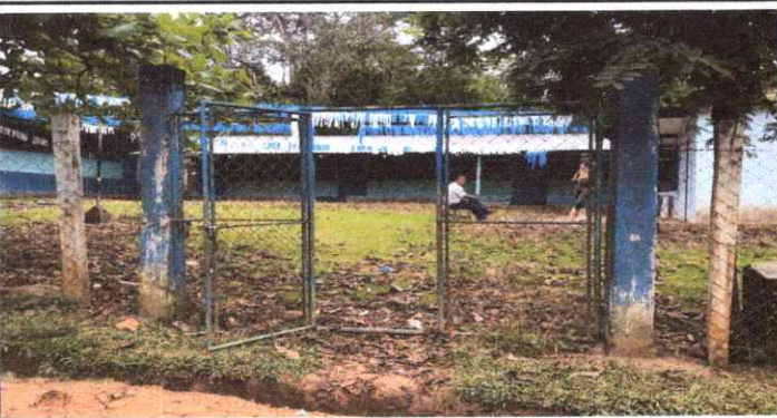
EL PORTÓN DE INGRESO ESTÁ EN PESIMAS CONDICIONES, SE METEN ANIMALES A DESTRUIR E INTERRUMPIR