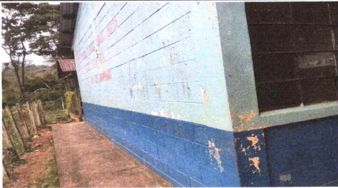
LAS PAREDES ESTÁN DESCOLORIDAS Y TIENEN HUMEDAD, NO REFLEJAN UN AMBIENTE AGRADABLE EN EL ENTORNO.