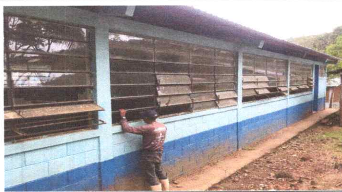
MAL ESTADO DE LA ESTRUCTURA METALICA Y VIDRIOS DE LAS VENTANAS.