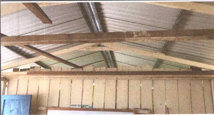
LA MADERA ES VIEJA Y SE ENCUENTRA EN MAL ESTADO DEBIDO A LA ANTIGÜEDAD