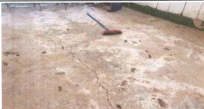
GRIETAS Y MOHO EN EL PISO DE LAS AULAS.