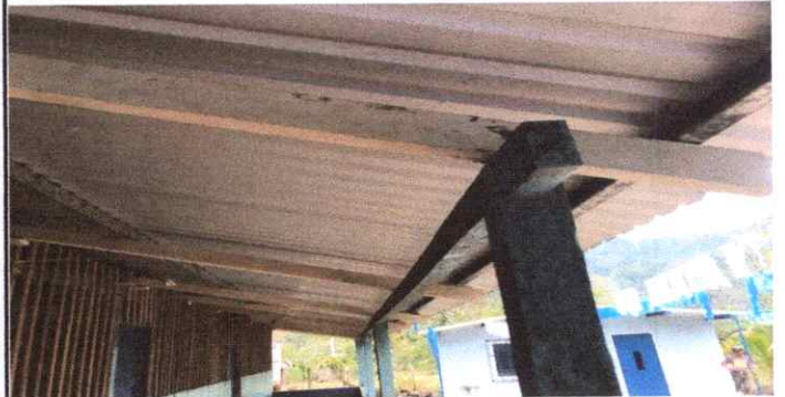
LA ESTRUCTURA DE MADERA NECESITA MEJORAS

Observación: Si es necesario se pueden agregar hojas adicionales y actualizar el número de hojas.