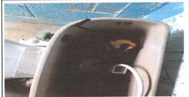
DETERIORO DE LOS ACCESORIOS DE LOS SANITARIOS.

Observación: Si es necesario se pueden agregar hojas adicionales y actualizar el número de hojas.