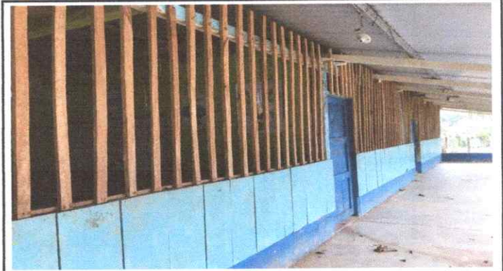
AULAS INSEGURAS PARA EL RESGUARDO DE ARCHIVOS O MATERIALES EDUCATIVOS.