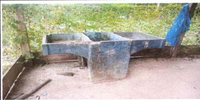
LA PILA NO SE UTILIZA PORQUE ESTÁ GRETADA Y VIEJA