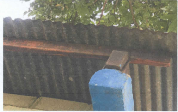
FOTO 2 . Sustitución de estructura de metal negro por metal galvanizado