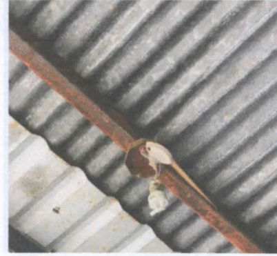
FOTO 8. Sustitución de plafoneras y focos ahorradores