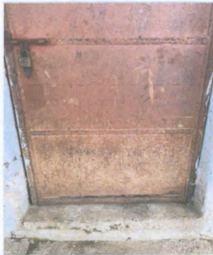
FOTO 3. Sustitución de puerta de metal