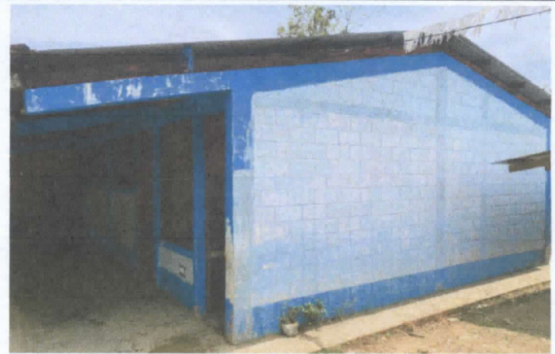
FOTO 6. pintura en muros exteriores e interiores.

Observación: Si es necesario se pueden agregar hojas adicionales y actualizar el número de hojas.