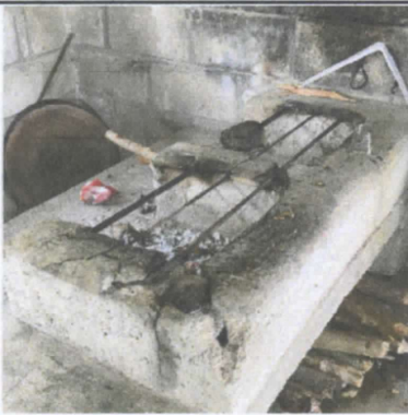
FOTO 9. Reparación de cocina