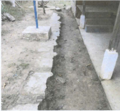
FOTO 7. Reparación de plancha de concreto en patio.