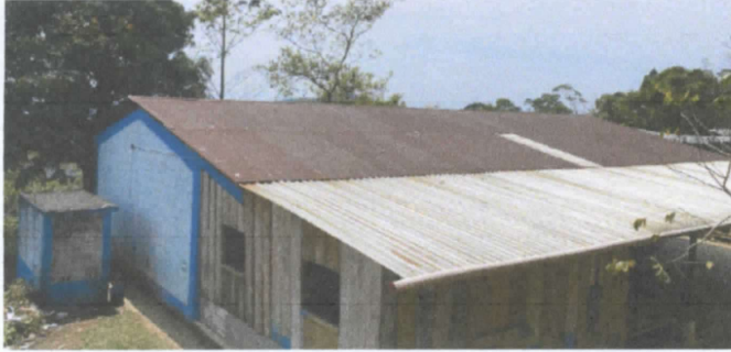
FOTO 1. sustitución de lámina de zinc por lámina troquelada aluzinc calibre 26