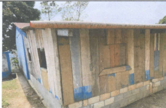
FOTO 5. Sustitución de canal de pvc, pescante del canal y la bajada