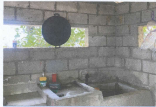
FOTO 10. Repello en muros

Observación: Si es necesario se pueden agregar hojas adicionales y actualizar el número de hojas.