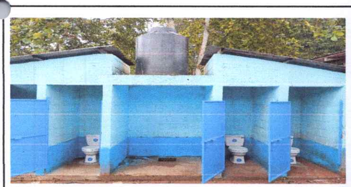
4.3 SUSTITUCION DE PUERTAS 10.3 SUSTITUCION DE INODOROS