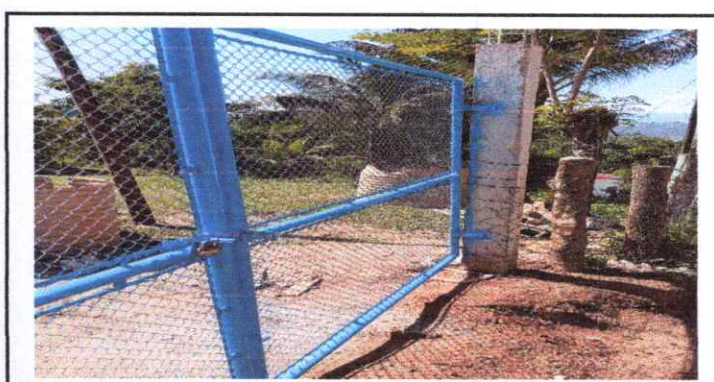
12 MANTENINMENTO DE PORTONES DE METAL

Observación: Si es necesario se pueden agregar hojas adicionales y regular el número de hojas.