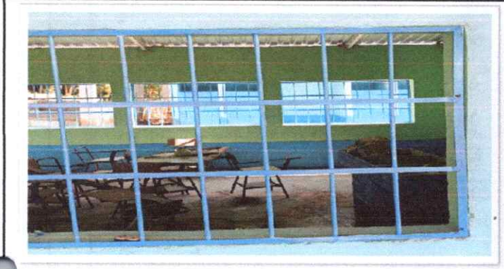
5.6 SUSTITUCION DE BALCONES DE METAL