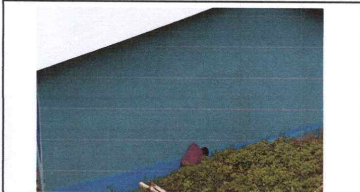
6 PINTURA EN MUROS EXTERIORES Y SUS INTERIORES