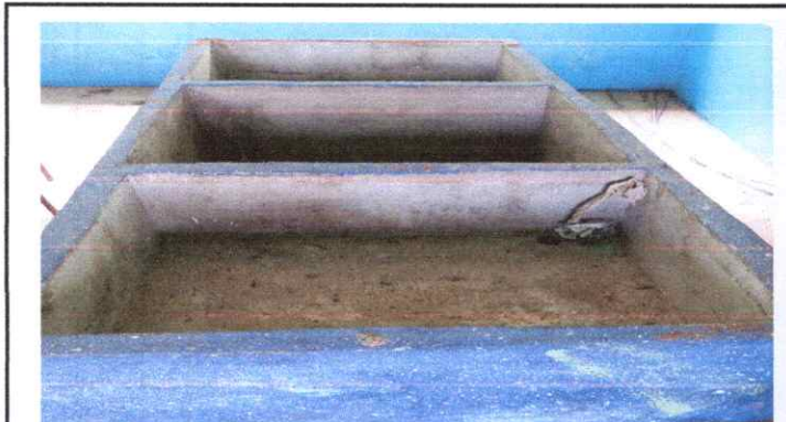
20.10 SUSTITUCION DE PILA DE CEMENTO DE DOS LAVADORES