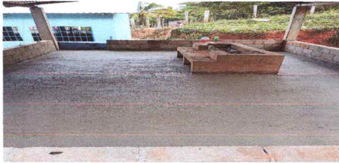
REPARACION DE PISO DE TORTA DE CEMENTO