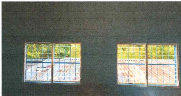
Foto 5. Sustitución de ventana de metal más vidrio