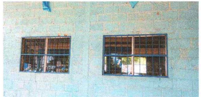
Foto 6. Sustitución de balcones de metal

Observación: Si es necesario se pueden agregar hojas adicionales y actualizar el número de hojas.