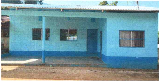
Foto 7. Pintura en muros exteriores e interiores