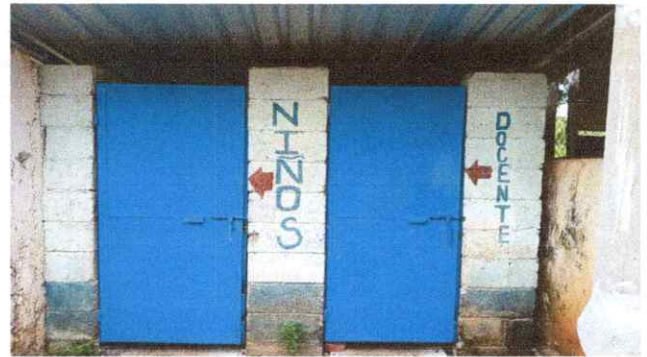
Foto 4. Sustitución de puerta en servicios sanitarios