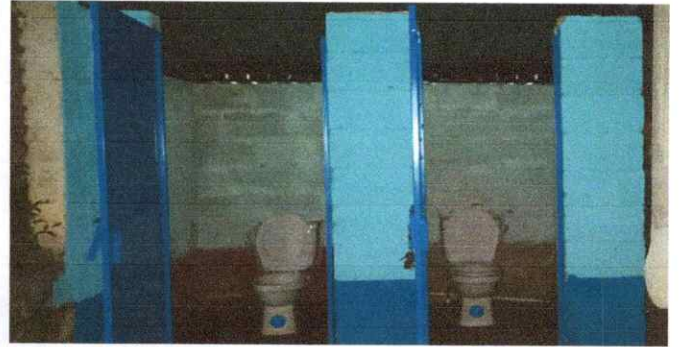
Foto 8. Sustitución de inodoro