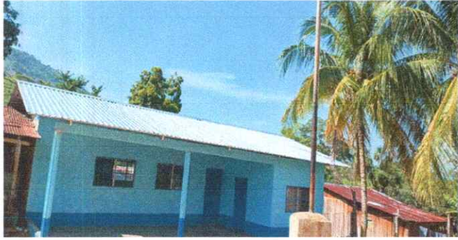
Foto 1. Sustitución de lamina por lamina troquelada