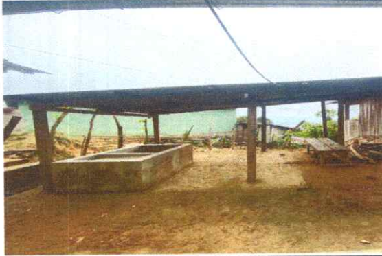
Sustitución de lámina troquelada aluzinc calibre 26