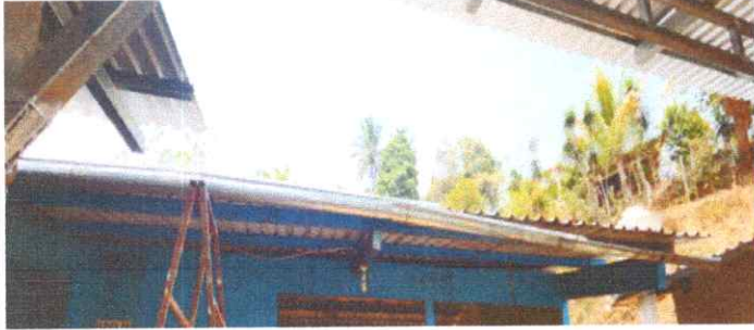
Sustitucion de canal de metal

Observación: Si es necesario se pueden agregar hojas adicionales y actualizar el número de hojas.