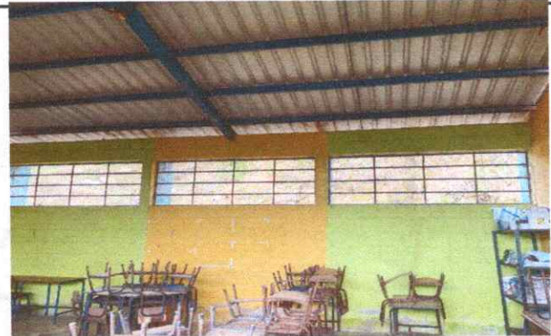
pintura de muros exteriores e interiores

Observación: Si es necesario se pueden agregar hojas adicionales y actualizar el número de hojas.