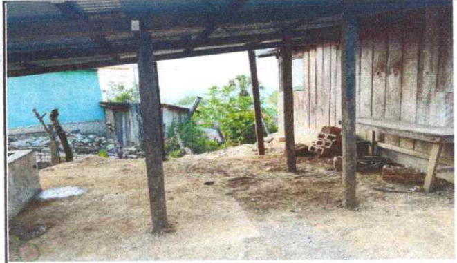
sustitución de estructura de soporte de madera, por metal