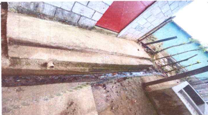
cuneta de concreto