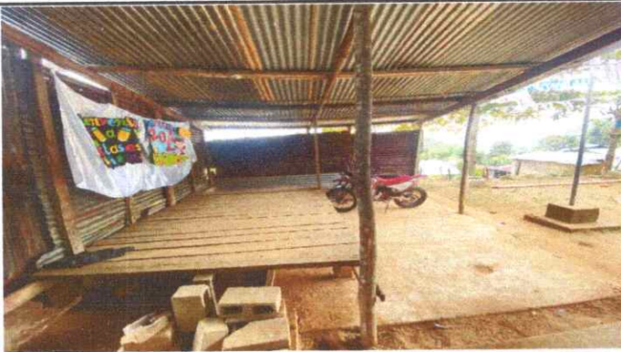
Reparación de torta de concreto