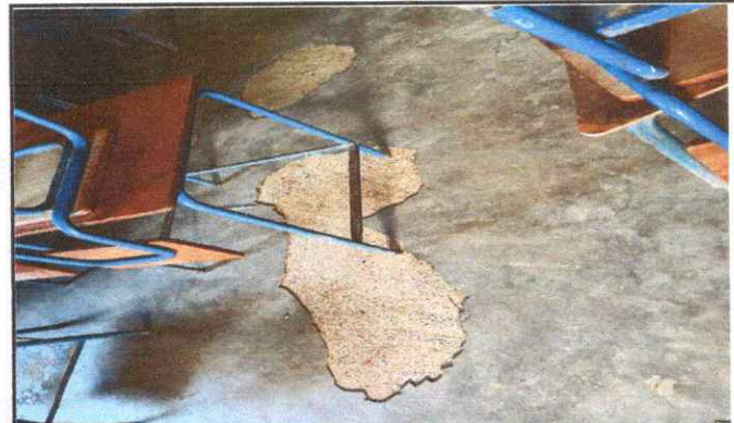
sustitución de torta de concreto