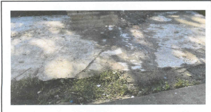
SUSTITUCION DE TORTA DE CONCRETO