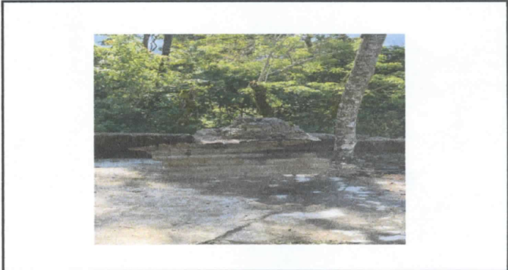
REPARACION DE COCINA