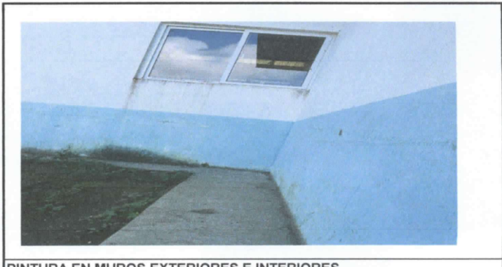
PINTURA EN MUROS EXTERIORES E INTERIORES

Observación: Si es necesario se pueden agregar hojas adicionales y actualizar el número de hojas.