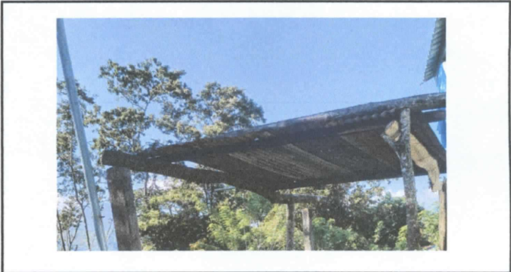
ESTRUCTURA DE TECHO