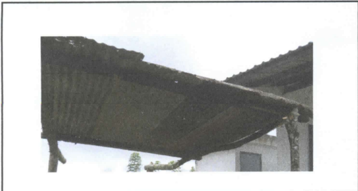
CUBIERTA DE LAMINA