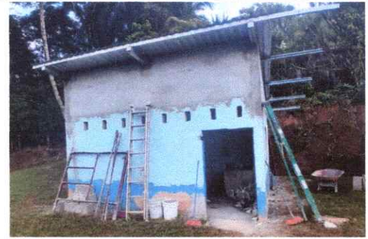
REPELLO EN MURO (COCINA)