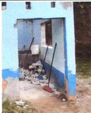
SUSTITUCION DE PUERTA DE COCINA