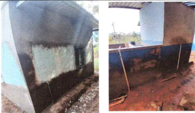
PINTURA EN MUROS EXTERIORES E INTERIORES (COCINA Y SANITARIOS)