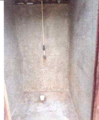
SUSTITUCION DE MEZCLADORA PARA DUCHA