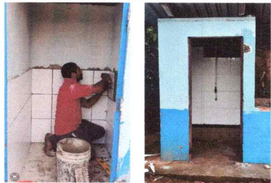
SUSTITUCIÓN DE AZULEJO DE BAÑOS Y DUCHA