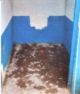
SUSTITUCIÓN DE INODOROS