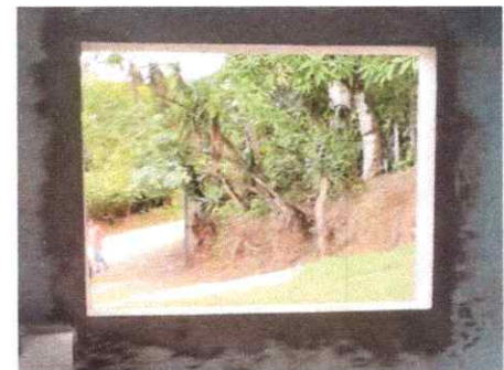
SUSTITUCION DE ESTUCTURA DE METAL DE VENTANA (COCINA)

Observación: Si es necesario se pueden agregar hojas adicionales y actualizar el número de hojas.