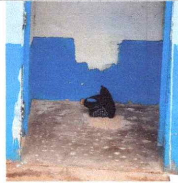
SUSTITUCIÓN DE ACCESORIOS INODORO (CONTRA LLAVE TUBO DE ABASTO Y TANQUE)

Observación: Si es necesario se pueden agregar hojas adicionales y actualizar el número de hojas.