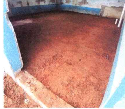
SUSTITUCIÓN DE TORTA DE CONCRETO (COCINA)