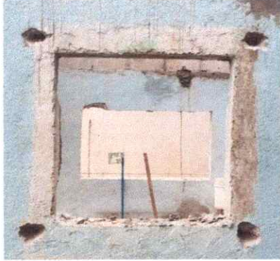
SUSTITUCION DE BALCONES DE METAL (COCINA)