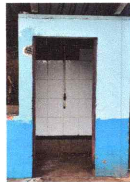
SUSTITUCION DE PUERTA EN SERVICIOS SANITARIOS