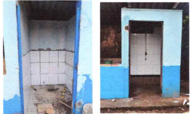
SUSTITUCION DE PISO CERAMICO (ANTIDESLIZANTE EN SAMITARIOS Y DUCHAS)