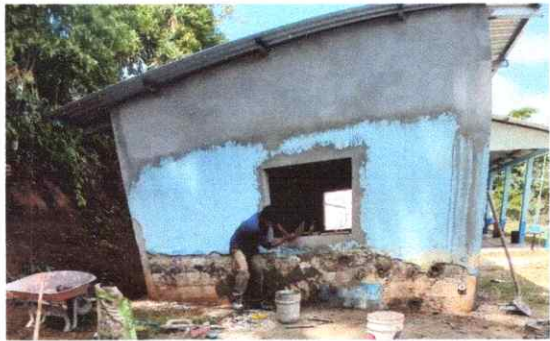
REPELLO EN MURO (COCINA)