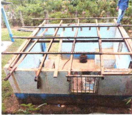
SUSTITUCION DE LAMINA POR LAMINA TROQUELADA ALUZINC CALIBRE 26 COCINA