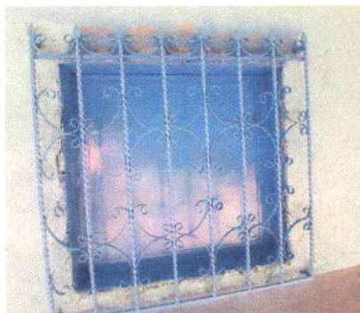
MANTENIMIENTO DE ESTRUCTURA DE METAL DE VENTANA (COCINA)