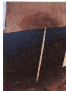
SUSTITUCIÓN DE TUBERIA EN LINEA PRINCIPAL (AGUA POTABLE)

Observación: Si es necesario se pueden agregar hojas adicionales y actualizar el número de hojas.