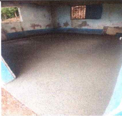
SUSTITUCION DE PISO GRANITO (COCINA)