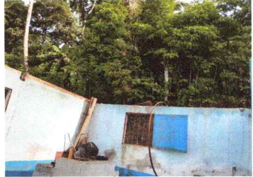
SUSTITUCION DE ESTRUCTURA SOPORTE DE MADERA POR METAL (COCINA)