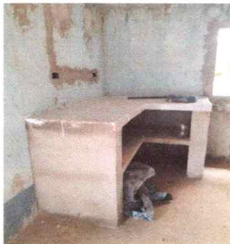
SUSTITUCION DE AZULEJO EN MUEBLE DE COCINA (MESÓN)