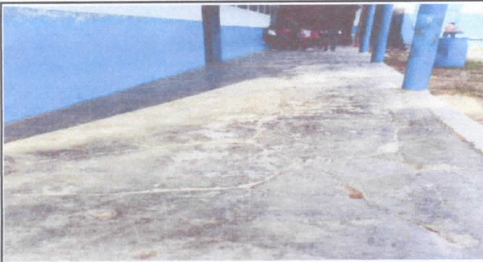
Sustitución de torta de cemento