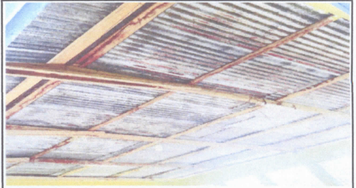
Cambio de estructura de madera a metal