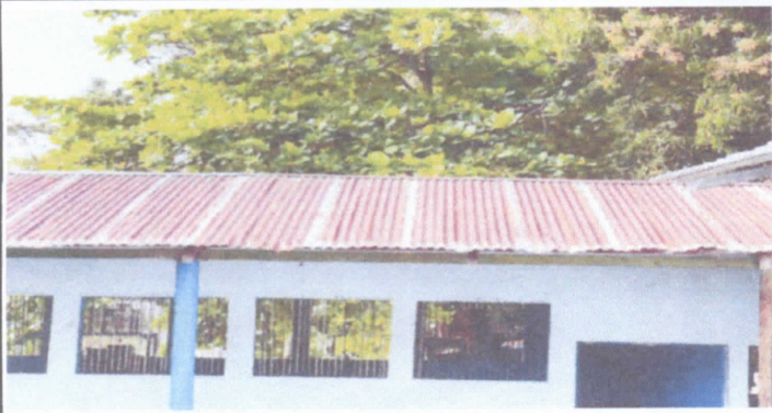
Sustitución de Cubierta de lámina