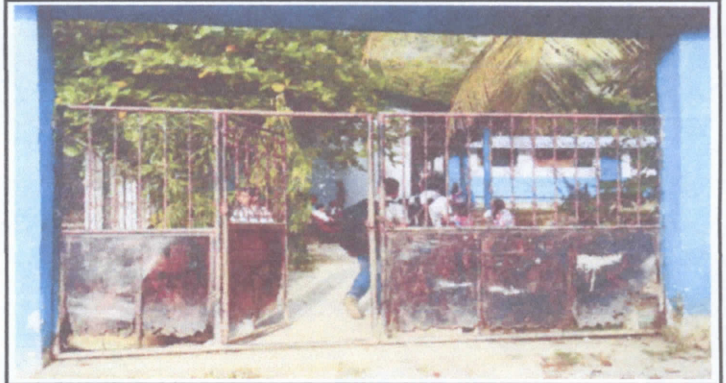
Mantenimiento de Portón principal