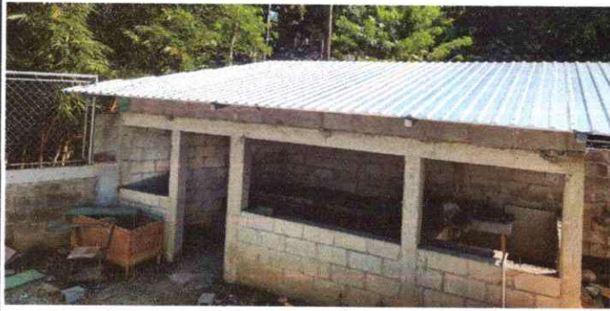
Foto1: Sustitución de cubierta de lámina