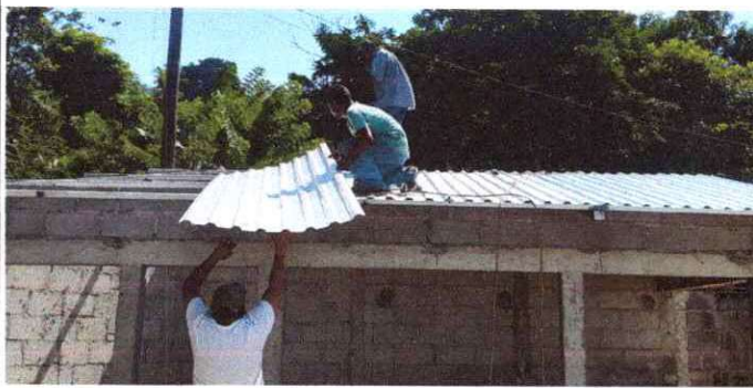
Foto1: Sustitución de cubierta de lámina