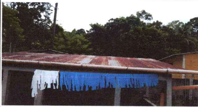
Foto1: Sustitución de cubierta de lámina