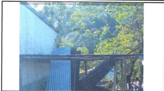
SUSTITUCIÓN DE LÁMINA POR LÁMINA TROQUELADA ALUZINC CALIBRE 26