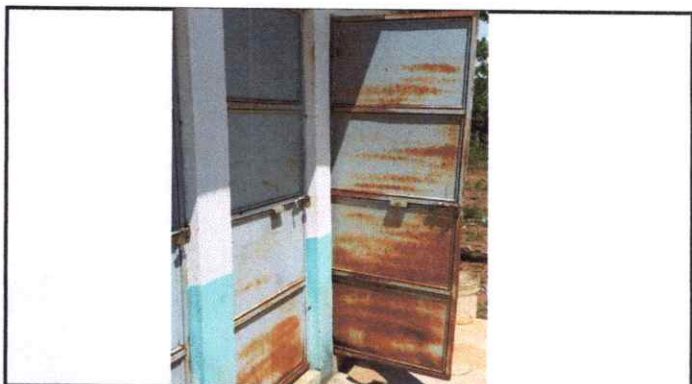
MANTENIMIENTO A ESTRUCTURA (LIJADO, CAMBIO DE TUBO, CEPILLADO, SUJECIONES, APLICACIÓN DE PINTURA) A PUERTAS SERVICIOS SANITARIOS