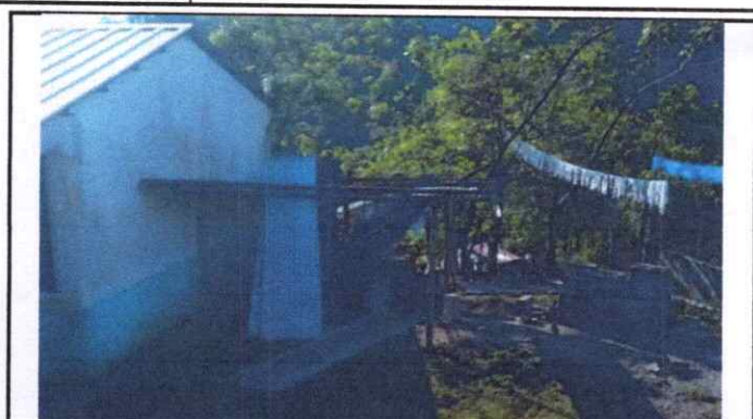
SUSTITUCIÓN DE ESTRUCTURA DE SOPORTE DE MADERA POR METAL