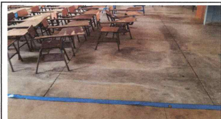
SUSTIRUCION DE PISO DE TORTA DE CONCRETO A PISO CERAMICO