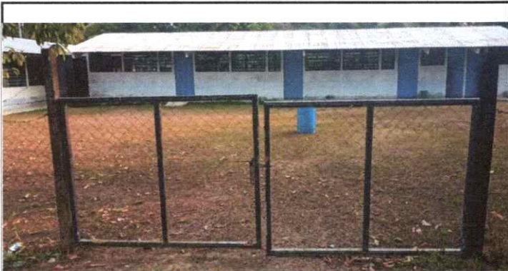
SUSTITUCION DE PORTONES DE INGRESO