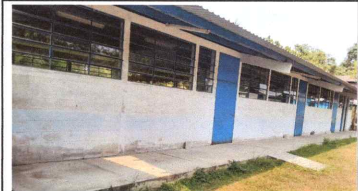
PINTRA DE MUROS INTERIORES Y EXTERIORES