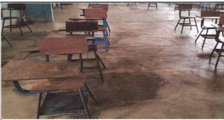
SUSTITUCION DE PISO DE TORTA DE CONCRETO A PISO CERAMICO