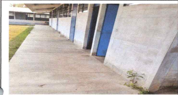
PINTURA DE MUROS INTERIORES Y EXTERIORES