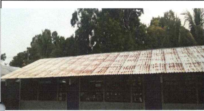
MANTENIMIENTO A LAMINA (LIJADO Y APLICACIÓN DE PINTURA)