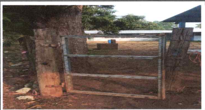
SUSTITUCION DE PORTONES DE INGRESO

Observación: Si es necesario se pueden agregar hojas adicionales y actualizar el número de hojas.