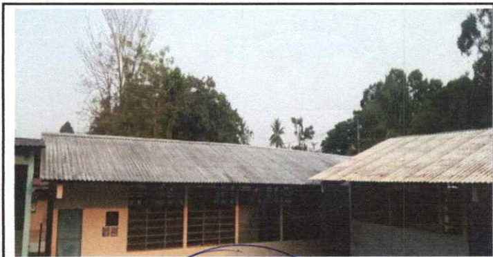
MANTENIMIENTO A LAMINA (LIJADO Y APLICACIÓN DE PINTURA.

Observación: Si es necesario se pueden agregar hojas adicionales y actualizar el número de hojas.