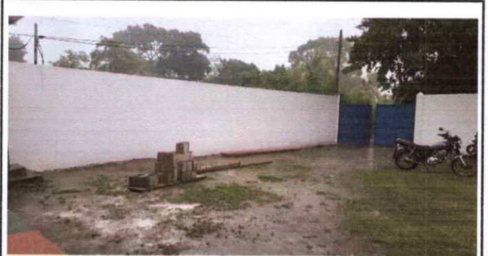
Pintura de muro interiores y exteriores