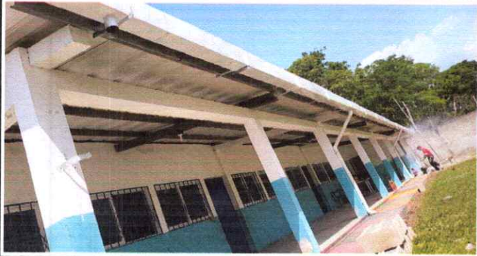
Canales y bajadas de agua pluvial: canal