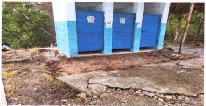
Puertas de metal sustitución de puertas