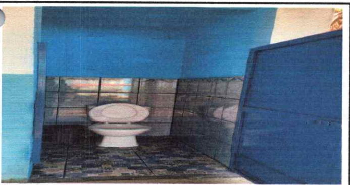
Sustitución de inodoros