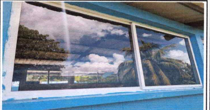
Ventanas Sustitución de vidrios