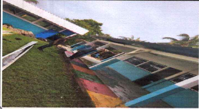
Canales y bajadas de agua pluvial: canal