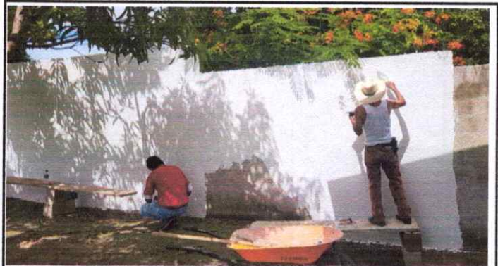
Pintura de muro interiores y exteriores