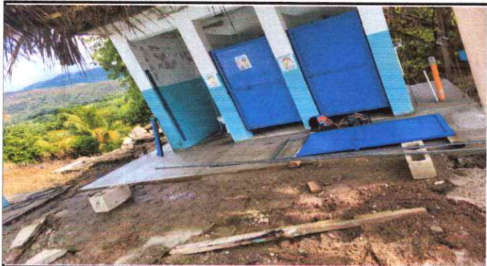
Puertas de metal sustitución de puertas