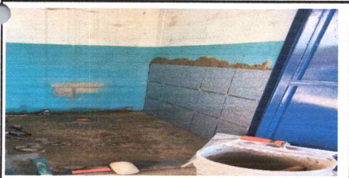
Sustitución de inodoros