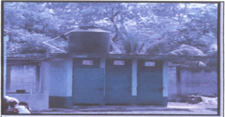
18.1 Depósito de agua 1100 lt

Observación: Si es necesario se pueden agregar hojas adicionales y actualizar el número de hojas.