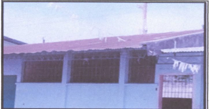
9.1 Pintura en muros exteriores e interiores