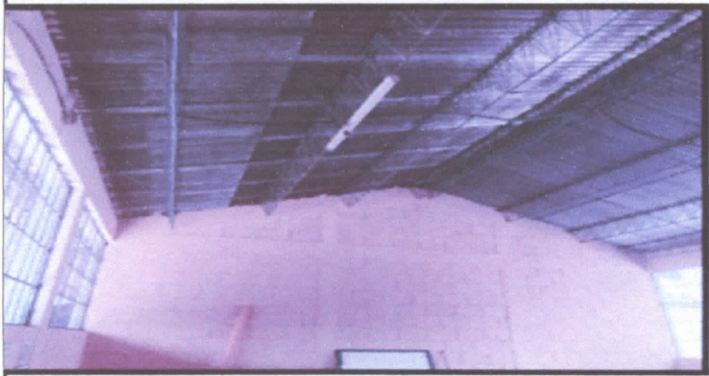
1.1 Sustitución de lámina, por lámina troquelada aluznic calibre 26