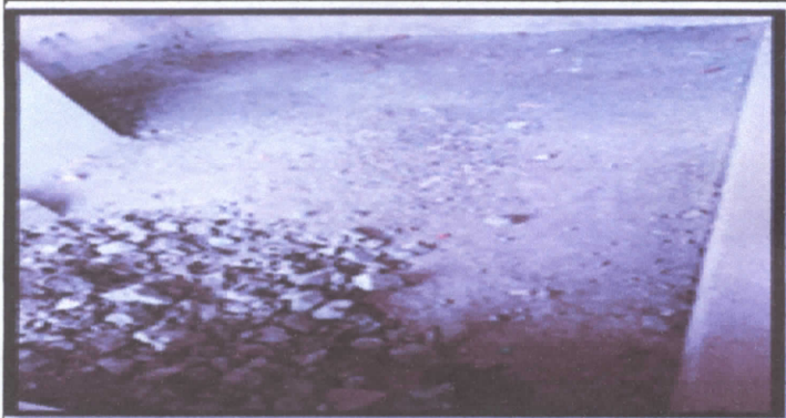
6.5 Sustitución de piso concreto