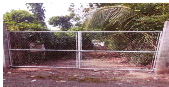
FOTO 3. PORTÓN TERMINADO Y SEGURO, VISTA TOTAL DE LOS TRABAJOS DE REMOZAMIENTO TERMINADOS

Observación: Si es necesario se pueden agregar hojas adicionales y actualizar el número de hojas.