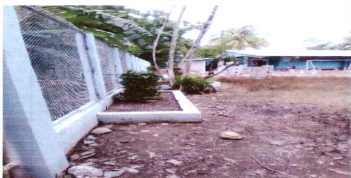
FOTO 1. MALLA TOTALMENTE TERMINADA, SE CUENTA CON MAYOR SEGURIDAD A LAS INSTALACIONES.