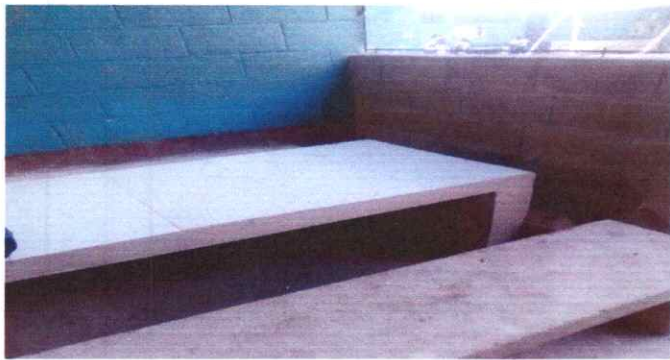
Instalaciones de Cocina terminadas, ahora brindan comodidad y seguridad para quienes hacen uso de ella

Observación: Si es necesario se pueden agregar hojas adicionales y actualizar el número de hojas.