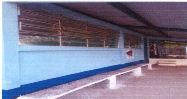
FOTO 2. TRABAJOS DE PINTIURA INTERIOR Y EXTERIOR TERMINADOS, INCLUYE PUERTAS DE ACCESO A LOS SALONES DE CLASES.