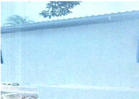
SELLADO DE GRIETAS EN MURO

Observación: Si es necesario se pueden agregar hojas adicionales y actualizar el número de hojas.