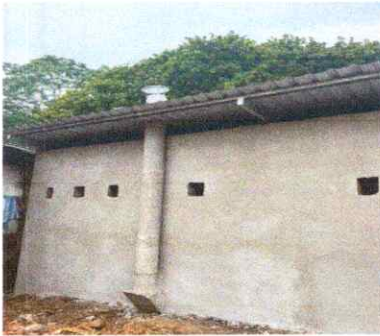
SUSTITUCION DE CHIMENEA DE CONCRETO