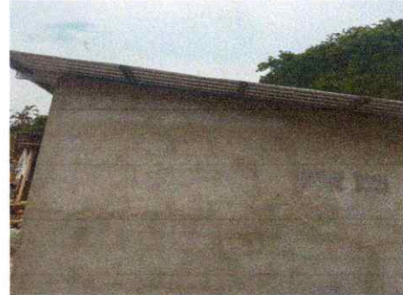
REPELLO EN MURO