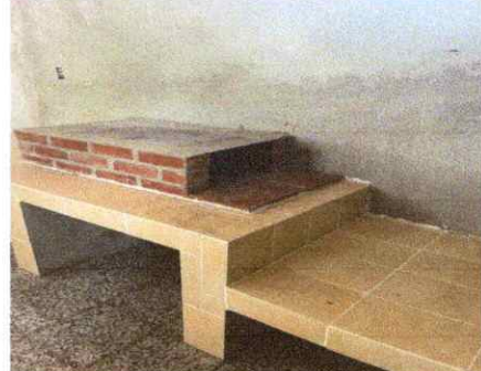
INSTALACION DE AZULEJO EN ESTUFA RURAL