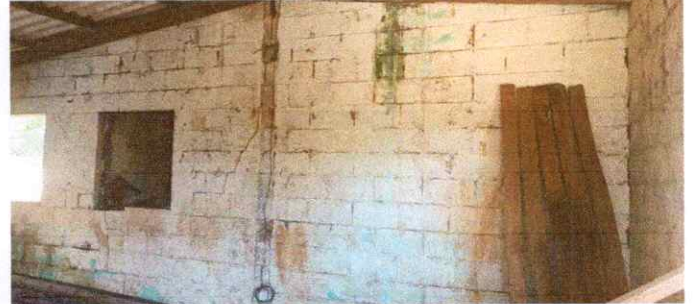
REPELLO EN MURO