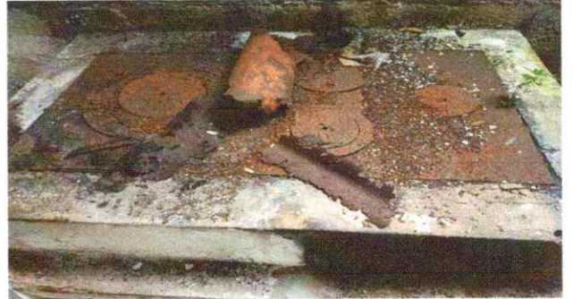
INSTALACION DE AZULEJO EN ESTUFA RURAL