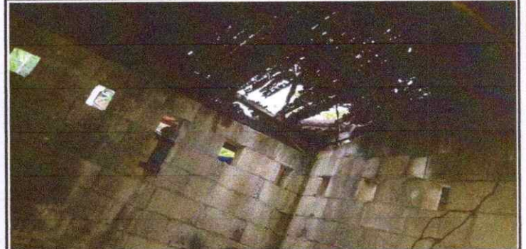
SUSTITUCION TECHO DE COCINA