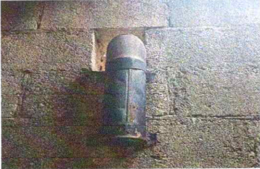
SUSTITUCION DE CHIMENEA DE CONCRETO