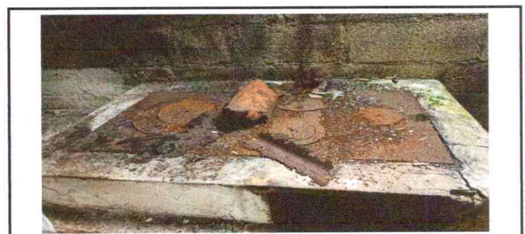
SUSTITUCION DE PLANCHA DE METAL

Observación: Si es necesario se pueden agregar hojas adicionales y actualizar el número de hojas.