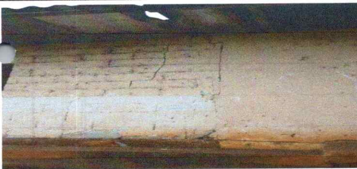
SELLADO DE GRIETAS EN MURO

Observación: Si es necesario se pueden agregar hojas adicionales y actualizar el número de hojas.