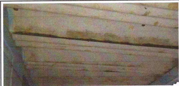
SUSTITUCION DE TECHO DE AULAS