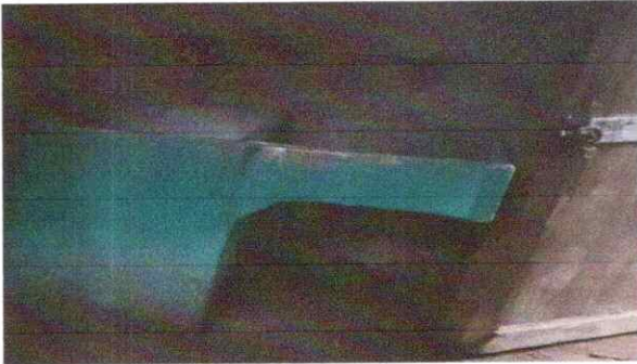
SUSTITUCION DE PILA DE DOS LAVADEROS