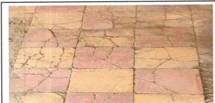
SUSTITUCION PISO DE GRANITO