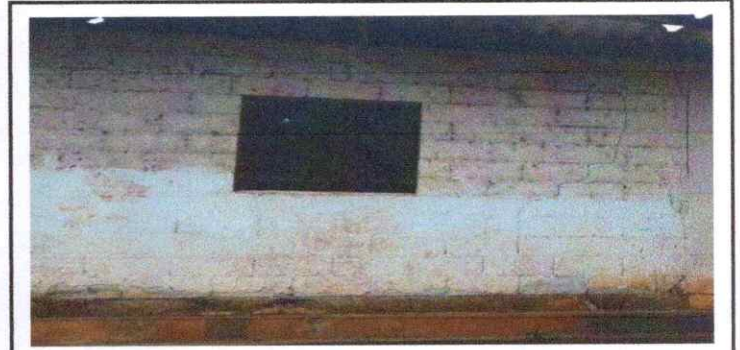
FABRICACION E INSTALACION DE BALCONES