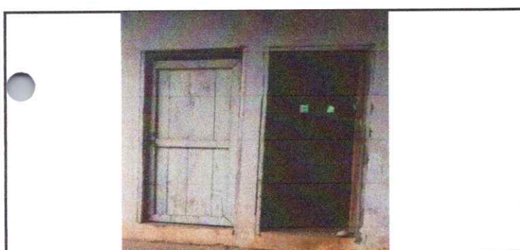
FABRICACION E INSTALACION DE PUERTA DE METAL