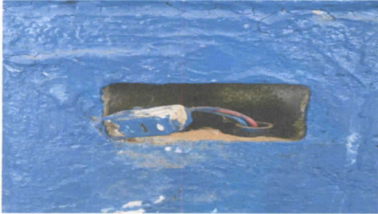
Foto 9. sustitucion de tomacorriente doble