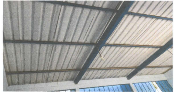
Foto 2. Sustitucion de estructura de soporte de matal por metal