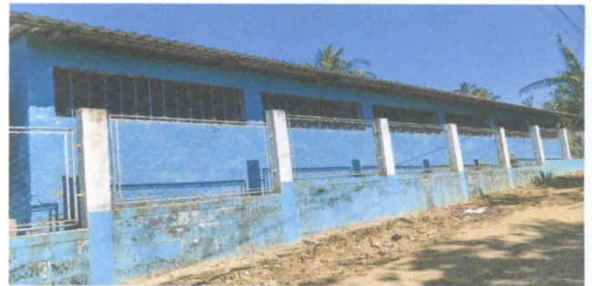
Foto 4. Pintura en muros exteriores e interiores