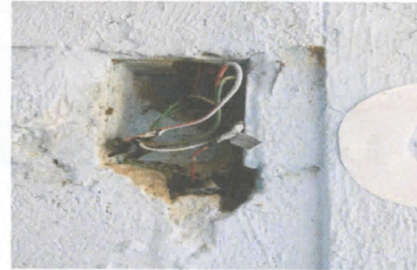
Foto 10. Sustrucion de flipones