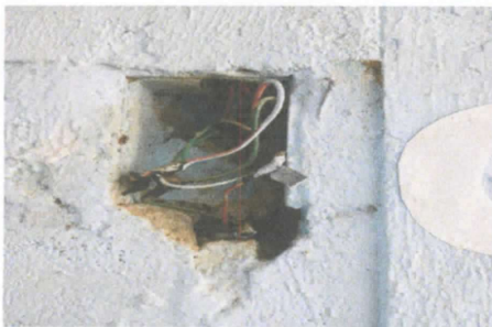
Foto 11. Sustrucion de tablero