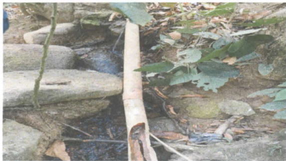
Foto 5. sustitucionde tuberia pvc libea principal de aguas negras