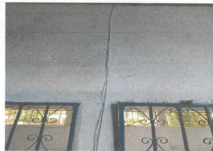
Foto 12. Sustrucion de cableado electrico

Observación: Si es necesario se pueden agregar hojas adicionales y actualizar el número de hojas.