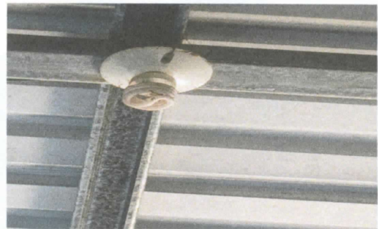
Foto 6. Sustitucion de lamparas

Observación: Si es necesario se pueden agregar hojas adicionales y actualizar el número de hojas.