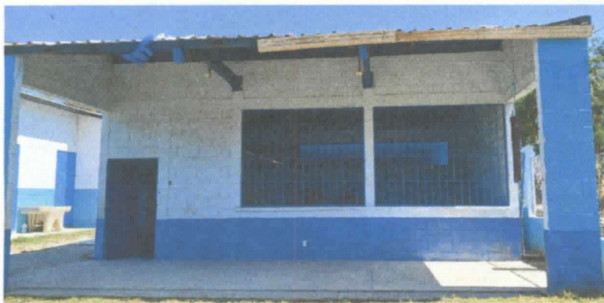
Foto 3. Sustitucion de canales pvc por pvc y bajadas de agua pluvial