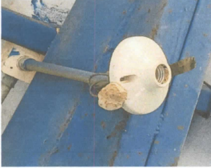
Foto 7. Sustrucion de plafonera