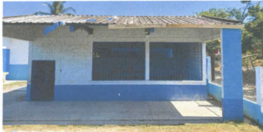
Foto 1. Sustitucion de lamina por lamina troquelada