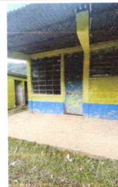
Puertas de Metal