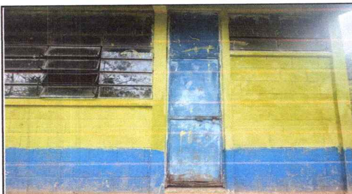
Puertas de Metal y ventanas