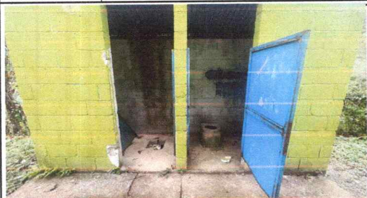
Cubierta de Lámina, Estructura de Techo, Piso y Servicio de baños y sus accesorios