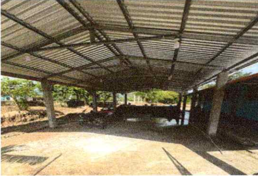
Foto1: SUSTITUCION DE LAMINA TROQUELADA