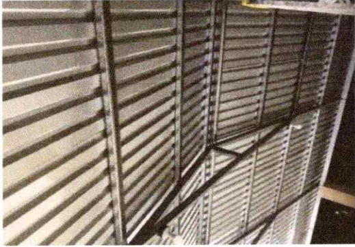
Foto1: SUSTITUCION DE LAMINA TROQUELADA