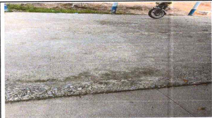
Reparación de piso de torta de cemento