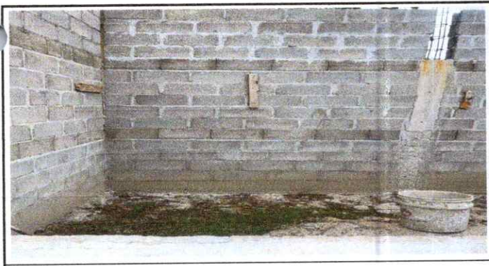
Repello en muro