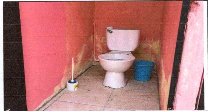
Sustitución de inodoro