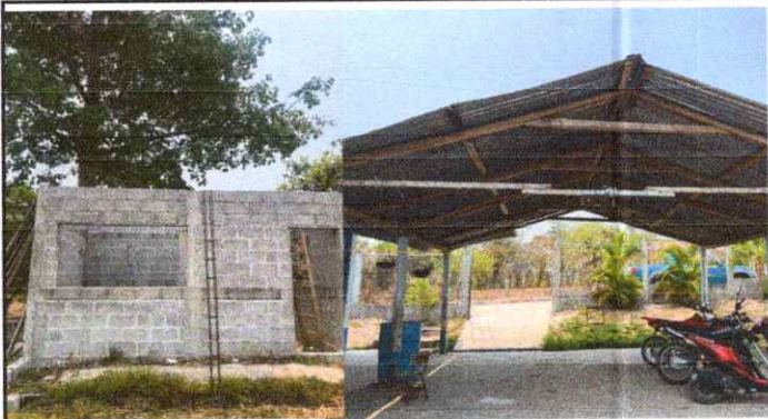
Sustitución de lamina por troquelada alucin calibre 26