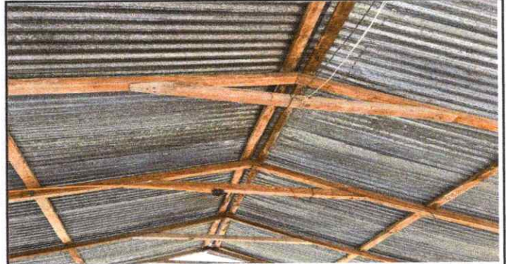
Sustitución de estructura de soporte de madera por metal