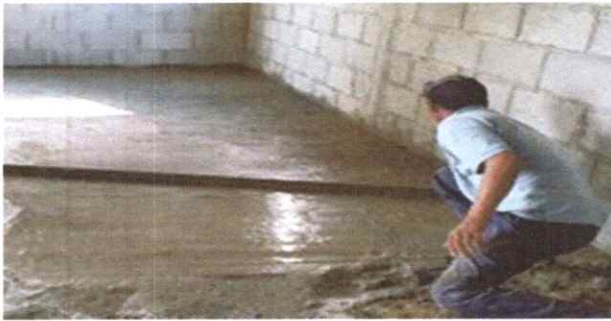
se procedió a reparar la torta del piso