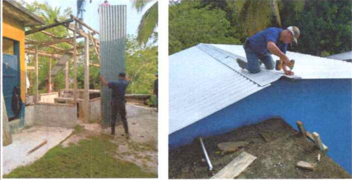
se quito toda la estructura del techo para luego comenzar con la debida reparación