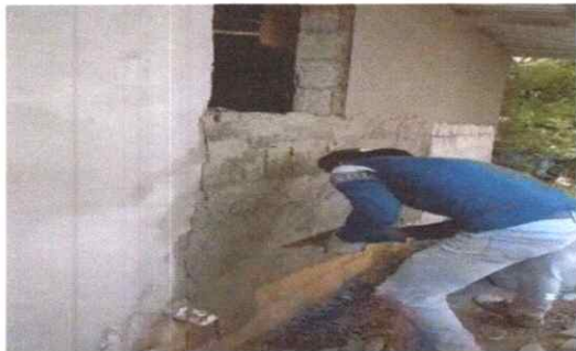
comienzos y mediados de la reparación de pared en cocina.

Observación: Si es necesario se pueden agregar hojas adicionales y actualizar el registro de fotos.