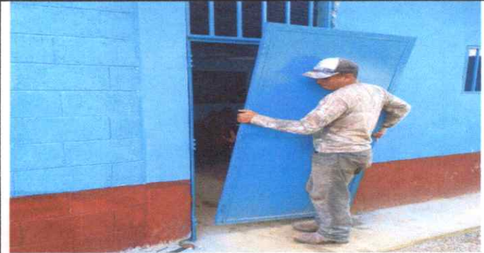
Se procedió a colocar las puertas