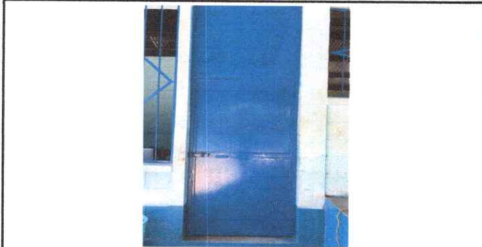
Foto 1: Puerta de un ambiente de la escuela, con su mantenimiento terminado