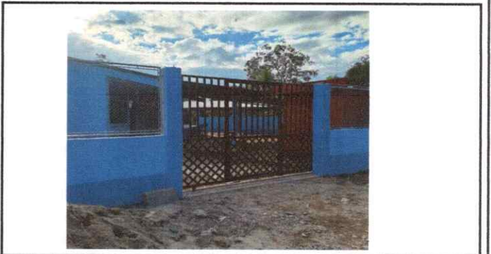
Foto 6: Portón de metal corredizo en el ingreso del establecimiento

Observación: Si es necesario se pueden agregar hojas adicionales y actualizar el número de hojas.