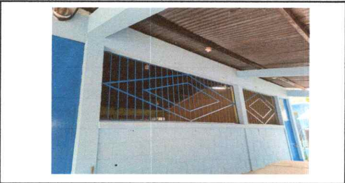
Foto 5: Fabricación e instalación de balcones de hierro puestos en el aula de cuarto grado