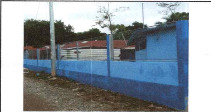
Foto 3: Muro perimetral con bloques de malla, repellido y pintado