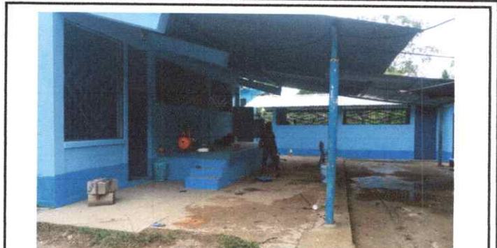
Foto 2: trabajo de pintura en muros exteriores de la escuela terminado