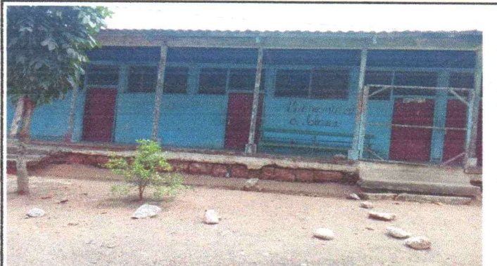
3. Suttitución de puertas