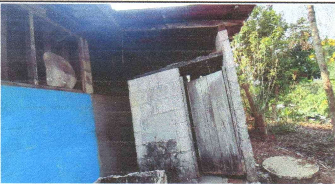
4. Suttitución de puertas en servicios sanitarios