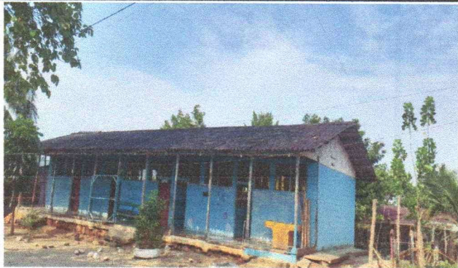
1. Suttitución de lámina