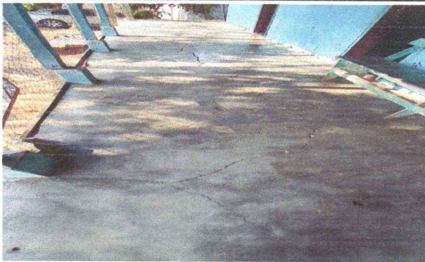
2.2 Tubo galvanizado