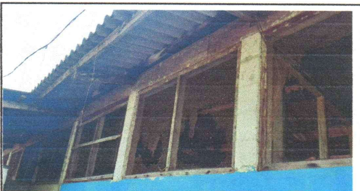
5. Suttitución de ventanas de madera por metal

Observación: Si es necesario se pueden agregar hojas adicionales y actualizar el número de hojas.