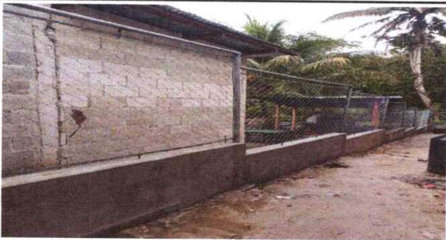
Foto 3: REPARACIÓN DE MURO PERIMETRAL DE BLOCK CON TUBO HG Y MALLA GALVANIZADA SOLERAS Y COLUMNAS PARTE LATERAL DERECHO