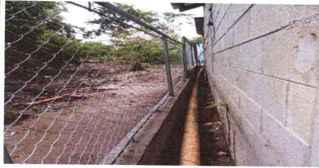
Foto1: REPARACIÓN DE MURO PERIMETRAL DE BLOCK CON TUBO HG Y MALLA GALVANIZADA SOLERAS Y COLUMNAS PARTE DE ATRÁS