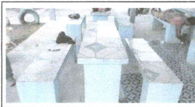
Foto 5: CERAMICO EN EL CORREDOR Y PASAMANOS DEL AULA DE PREPRIMARIA