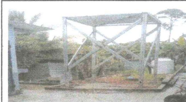
Foto 3: CONSTRUCCION DE UNA TORRE DE CEMENTO PARA ROTOPLAS Y SUS INSTALACIONES