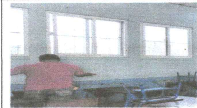
Foto1: PINTAR EL AULA INTERIOR